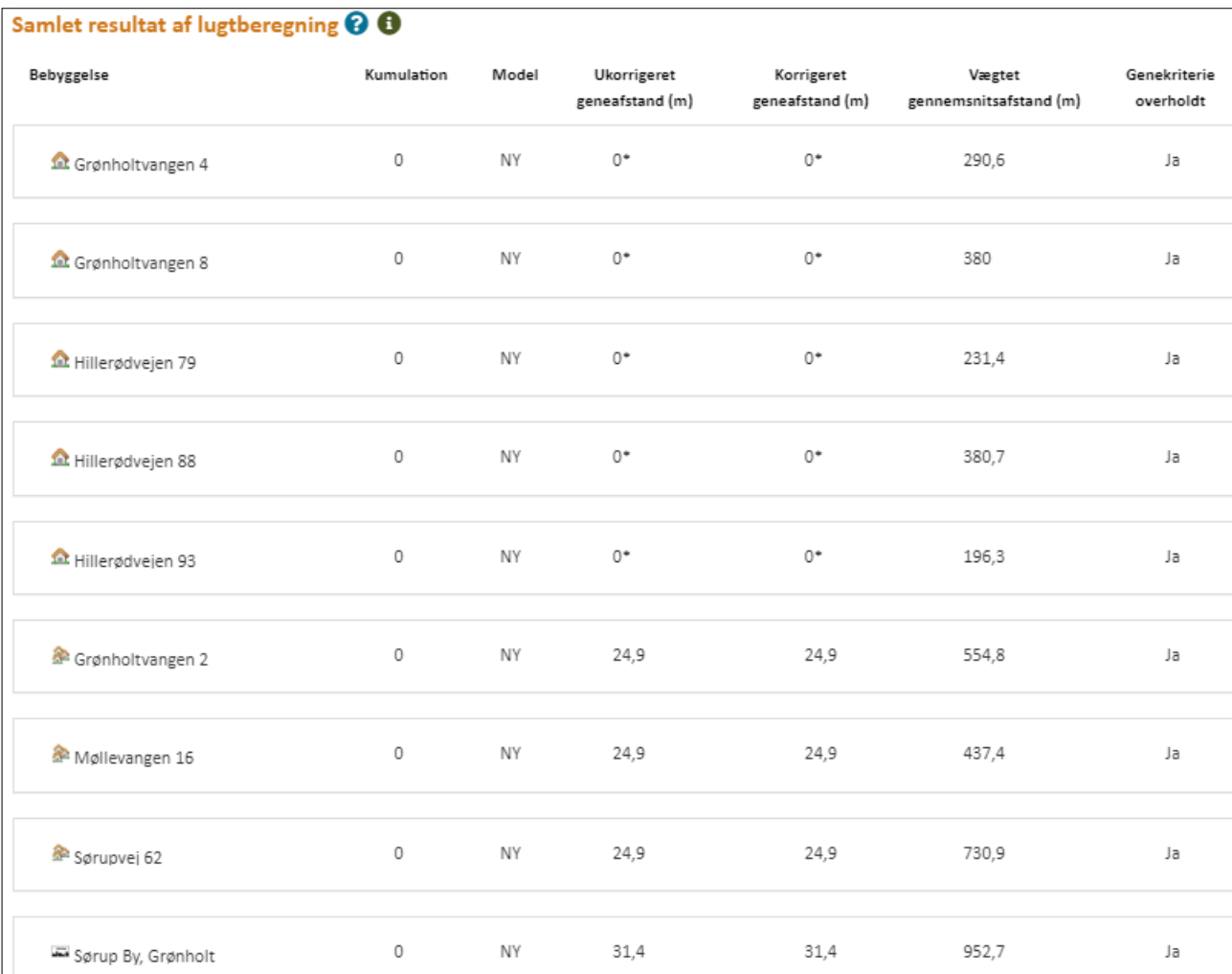
Figur 6 - Beregning af lugtgeneafstand, samt afstand til naboer.