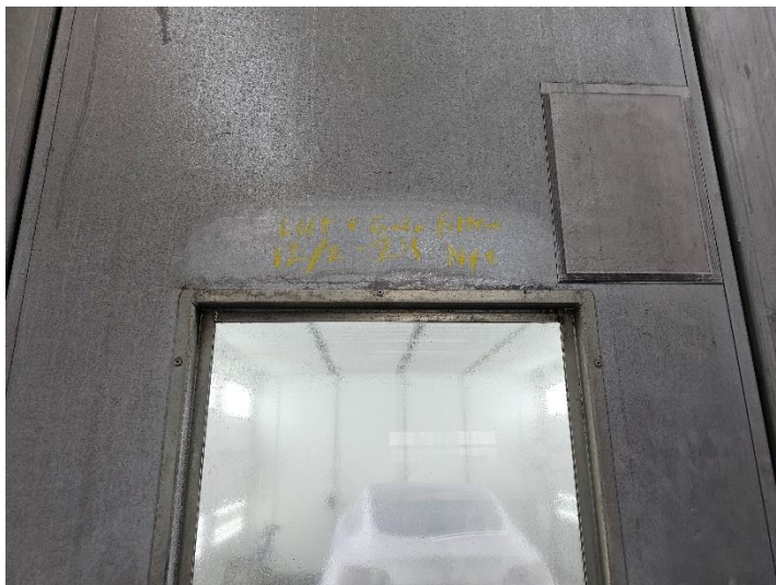
Notering af filterskifte ved filterne.

Sprøjtekabinerne er elektronisk styrede, således at det automatisk registreres, hvis der sker et trykfald over filterne, hvilket indikerer at kabinefiltererne skal skiftes. Virksomheden kender erfaringsmæssigt levetiden på filterne og skifter dem selv efter faste nedskrevne intervaller inden trykfaldet over filterne bliver stort nok til at udløse automatisk stop af anlægget.