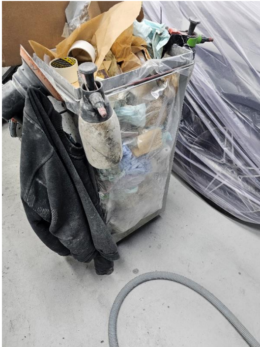
Rullebogn med blandet brændbart affald.

Elkjærs Autolakering blev under miljøtilsynet gjort bekendt med de nye regler for affaldssortering hos virksomheder, som har været gældende siden den 31. december 2022. De nye regler, som fremgår af affaldsbekendtgørelsens 4 § 60, betyder, at alt husholdningslignende affald fra virksomheder, skal udsorteres og bortskaffes i følgende affaldsfraktioner, som fremgår af affaldsbekendtgørelsens bilag 6: