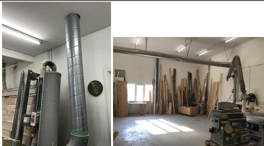
Ovenstående spåneudsug kører sammen ud i en bygning, hvor de har hvert sit filter, se nedenfor - der er ét hovedafkast fra de to udsug.