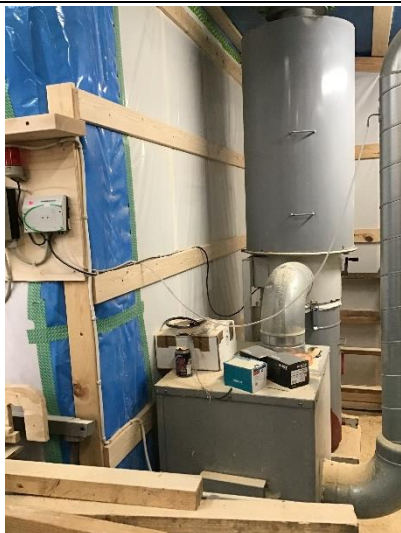
Spåneudsug der føres til 2. hovedafkast

Savene har posefilter-anlæg uden udvendigt afkast, se nedenfor: