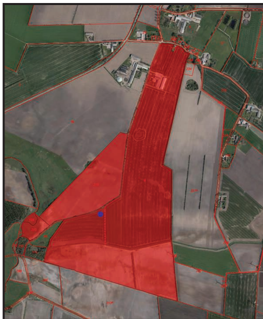
Figur 2: placeringen af beholderen på ejendommen.

Der opføres en gyllebeholder på 4000 m 3 på matr. nr. 4 Roost, Arrild. Beholderen opføres uden teltoverdækning, men der ønskes mulighed for senere at etablere en teltoverdækning. Beholderen opføres ca. 1000 m. syd for ejendommens eksisterende bygninger. Placeringen på ejendommens areal, ses af figur 2.