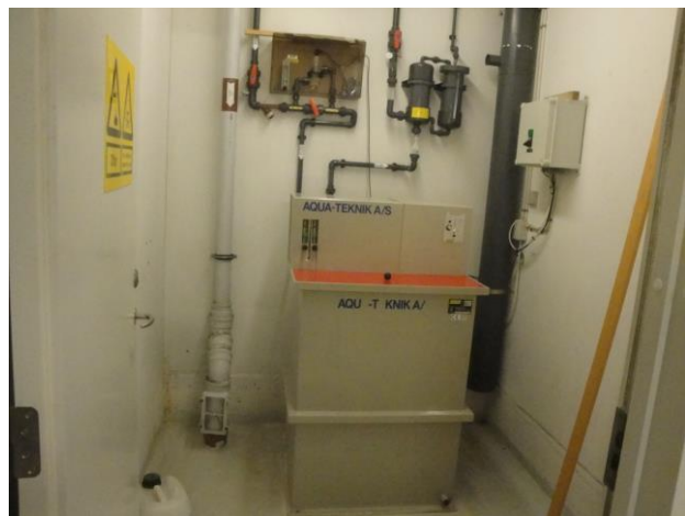
3 tryksandfiltre (Ø2350 mm) til filtrering af bassin vandet. Chlor-elektrolyse anlægget.

Til filtrering af bassin vandet er der 3 sandfiltre og 1 kulfilter.