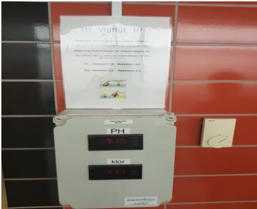
Fjernaflæsning af frit chlor og pH

I svømmesalen er der nu opsat en fjernaflæsning, som viser frit chlor og pH. Dette display aflæses ved lukketid og noteres i driftsjournalen som en acceptabel lukkemåling.