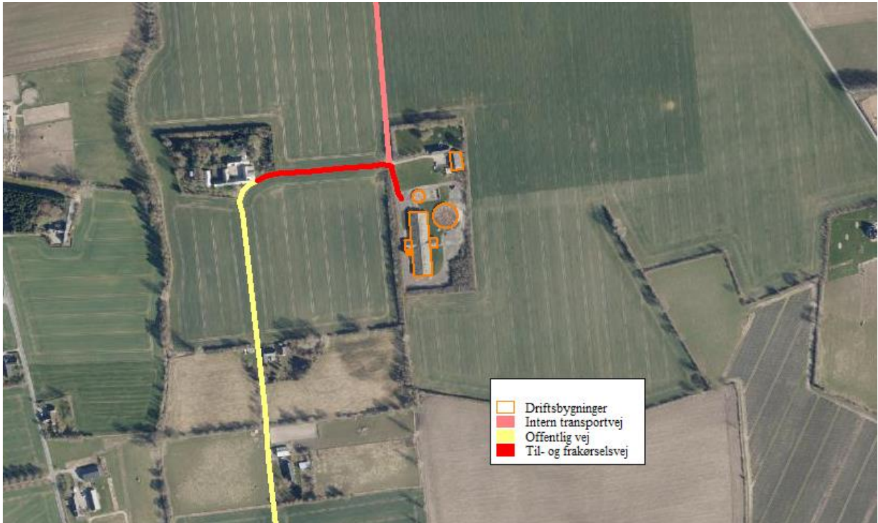
[Figur 4.1] Til- og frakørselsveje til ejendommen. Det forventes, at ca. 50% af transporterne sker via den interne transportvej.

Det vurderes, at transporter ikke vil give anledning til væsentlige gener for omboende, da der dels er tale om et relativt begrænset antal transporter og dels er tale om gode til og frakørselsforhold, hvor der er langt fra overkørsel til offentlig vej og nabobeboelser.