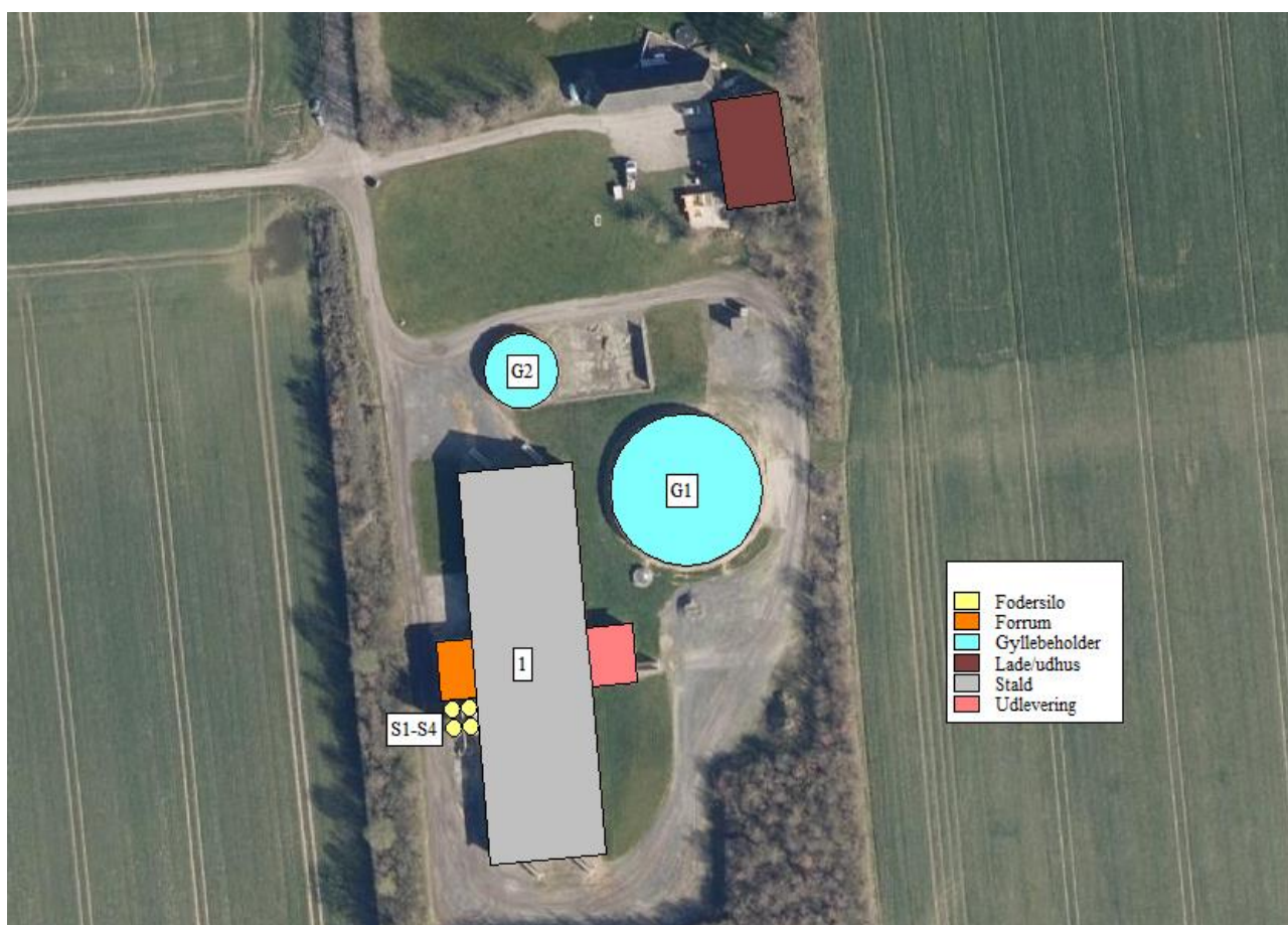
Figur 2.2. Oversigtskort over husdyrbrugets staldanlæg.

Alle stalde er med mekanisk ventilation.