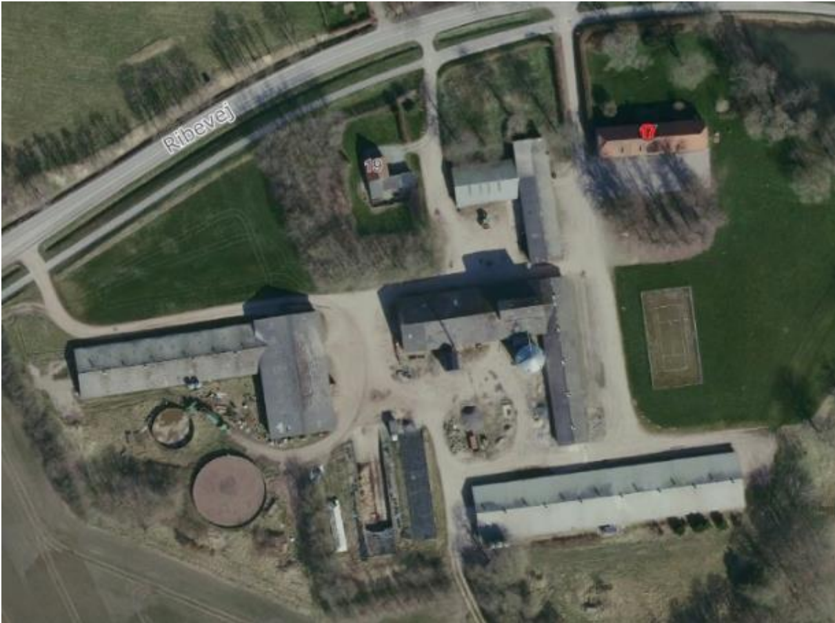
Figur 1. Oversigt over bygninger.