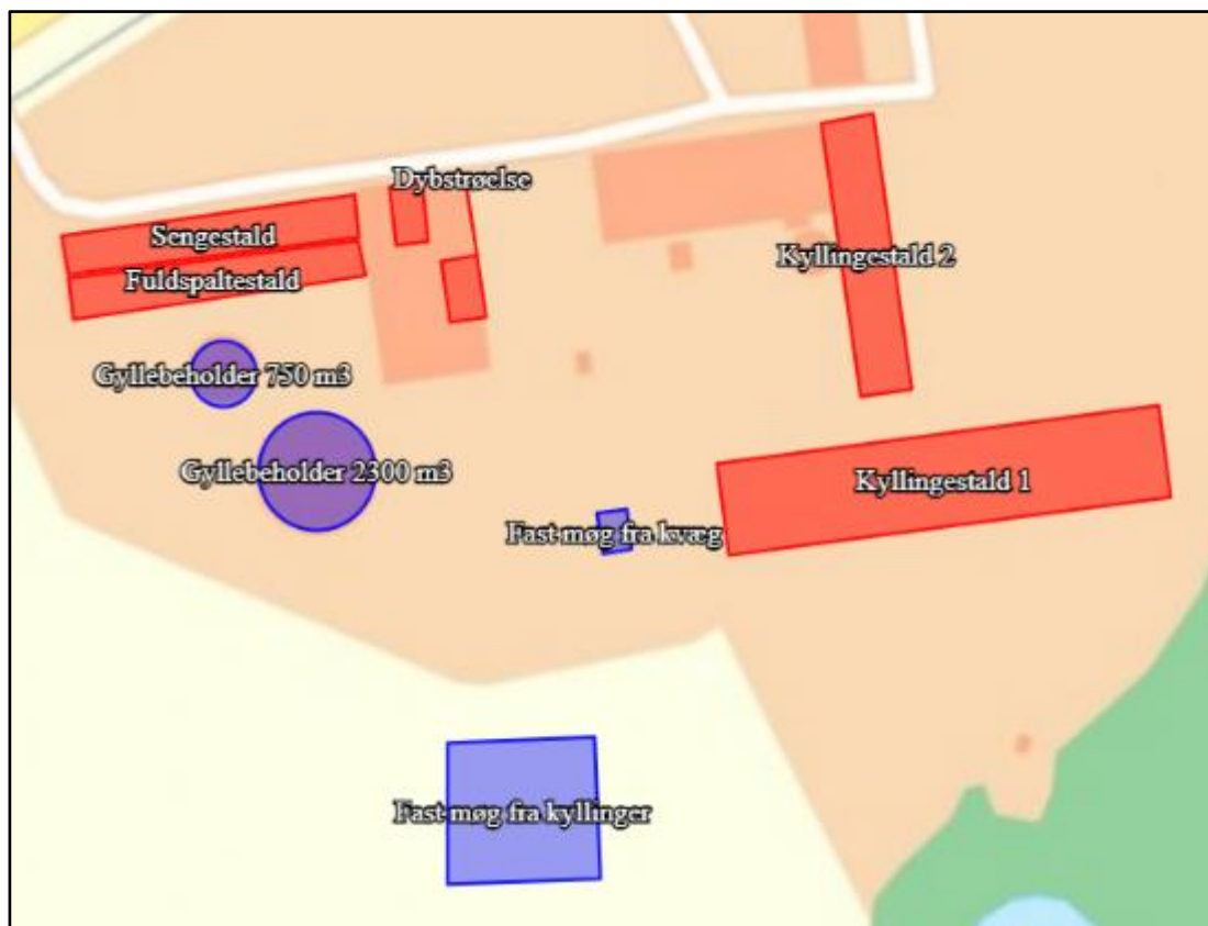
Figur 2. Placering af produktionsarealer og areal til opbevaring af husdyrgødning.

Ribevej 17 skønner, at der er følgende produktionsarealer: