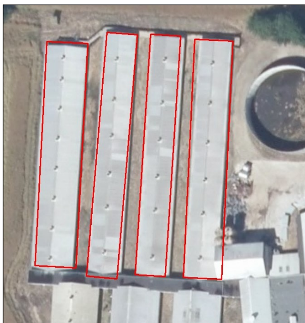
Figur 1. Husdyrbrugets driftsbygninger.

Husdyrbruget ligger sydvest for Lintrup i et landbrugslandskab med spredte gårde. Bygningernes anvendelse og placering på ejendommen er vist i tabellen og figuren herunder.