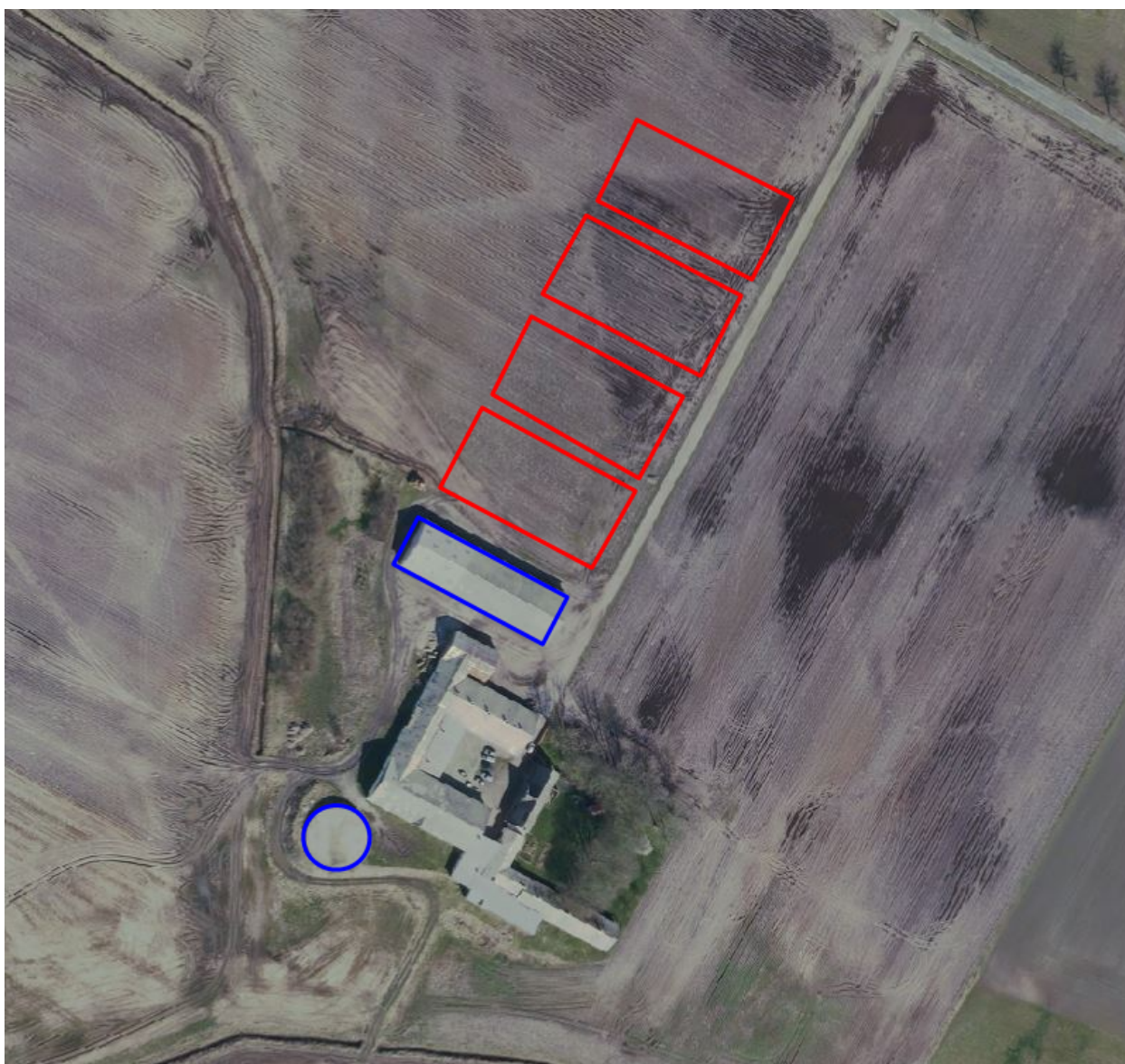
Luftfoto: Indtegningen af stalde (rød streg) og opbevarings anlæg for husdyrgødning (blå streg) i revurderingsskema 224345, undtagen markstakken.

I revurderingen skal fordampningen af ammoniak beregnes ud fra produktionsarealet, dvs. det samlede stiareal i samtlige bygninger samt overfladen af opbevaringsanlæg for husdyrgødning. Da de nye bygninger endnu ikke er opført, tager vi udgangspunkt i bygningernes størrelse og placering som anført i ansøgningen om miljøgodkendelse (det anføres i ansøgningens bilag, at hver stald skal være 2.550 m 2 inkl. forrum, og at der vil være 100 m til offentlig vej).