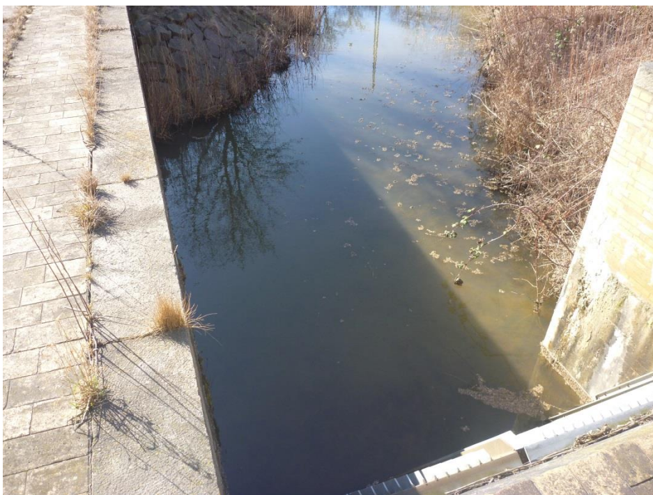
Figur 2. Perkolat fra hovedledningen.