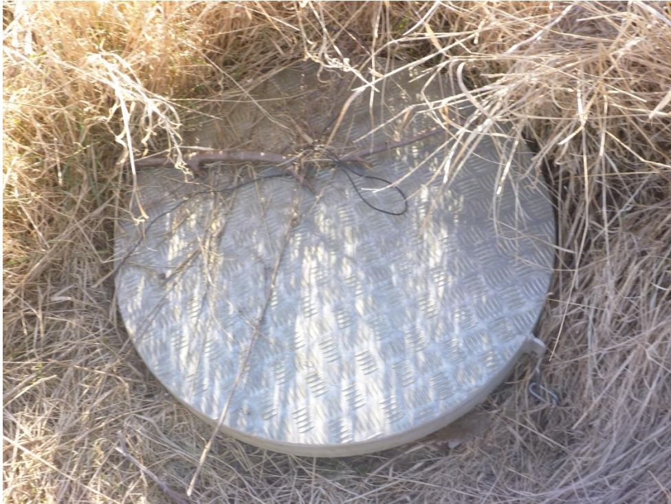
Figur 3. Uaflåst grundvandsbrønd