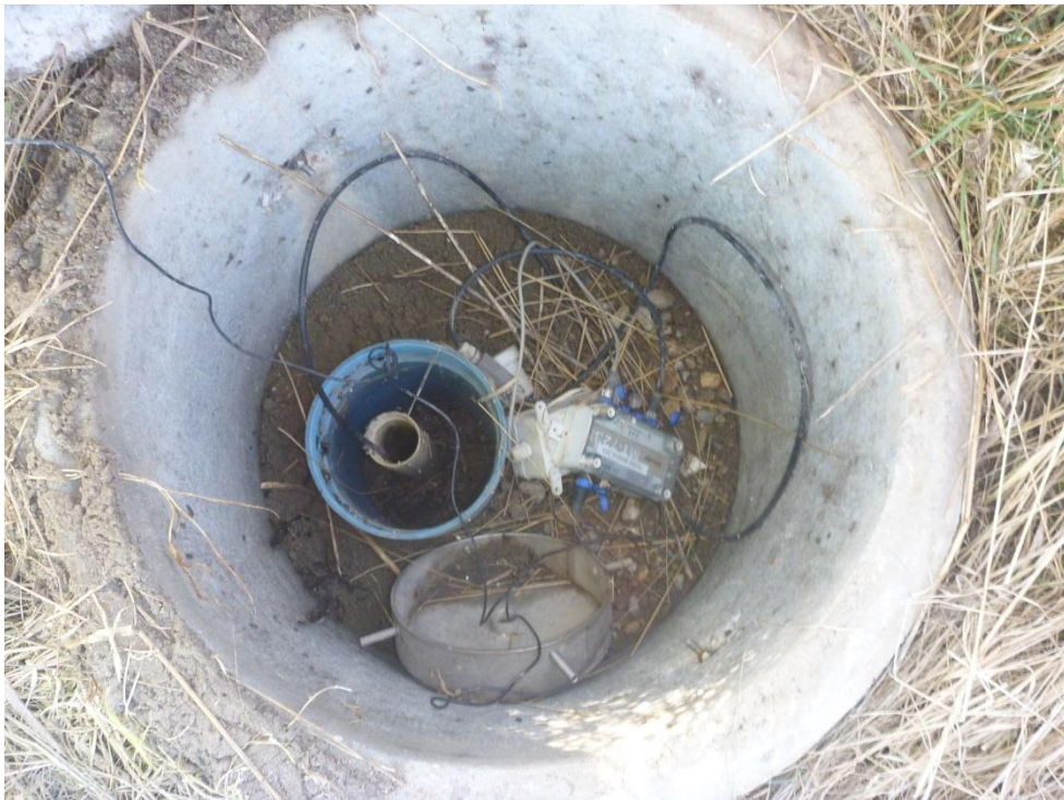
Figur 4. Grundvandsbrønd, uden vandtæt lukning af forerør.