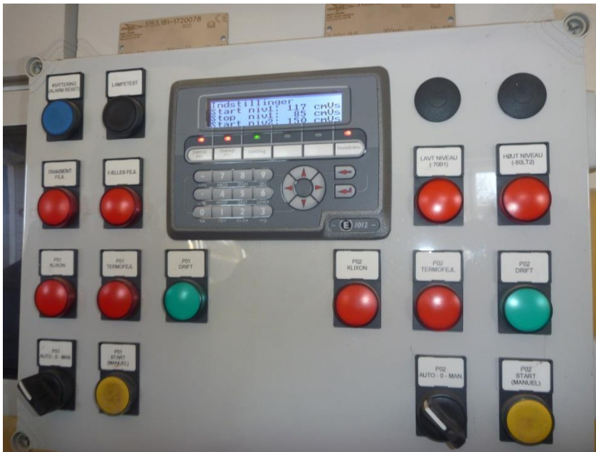
Figur 5. Anlæg for fejlmelding af system- eller pumpefejl.

Ved pumpestation nord er der installeret et system som kan melde systemfejl til den ansvarlige. Installationen giver en øget opmærksomhed på optimal drift af pumperne (figur 5).