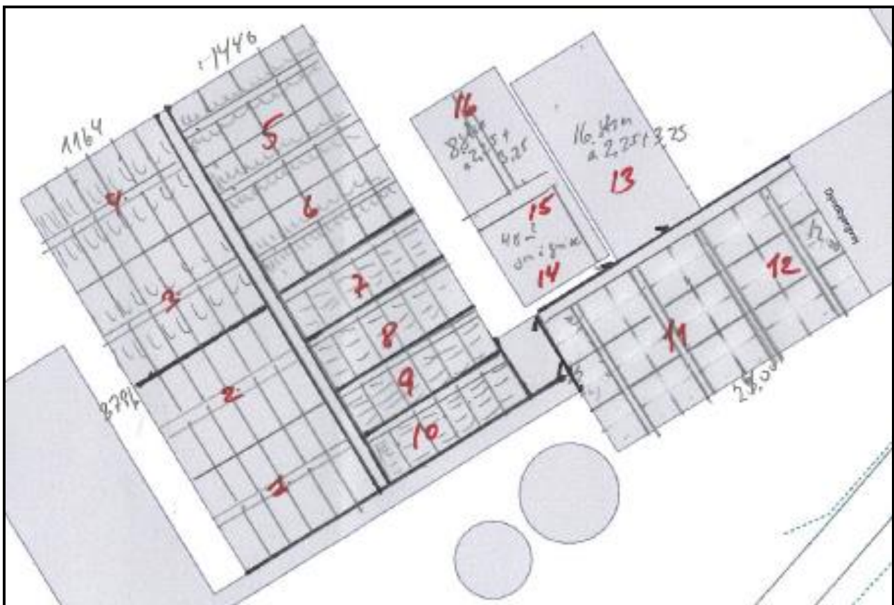
Figur 2.3. Oversigtskort over staldafsnit og produktionsareal.