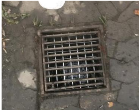
Figur 3 Foto af ekstra rist i regnvandsbrønd.

Vilkår 10 skal sikre uhensigtsmæssig affaldsflugt af plast og papir og øvrigt restaffald til regnvandsledningen.