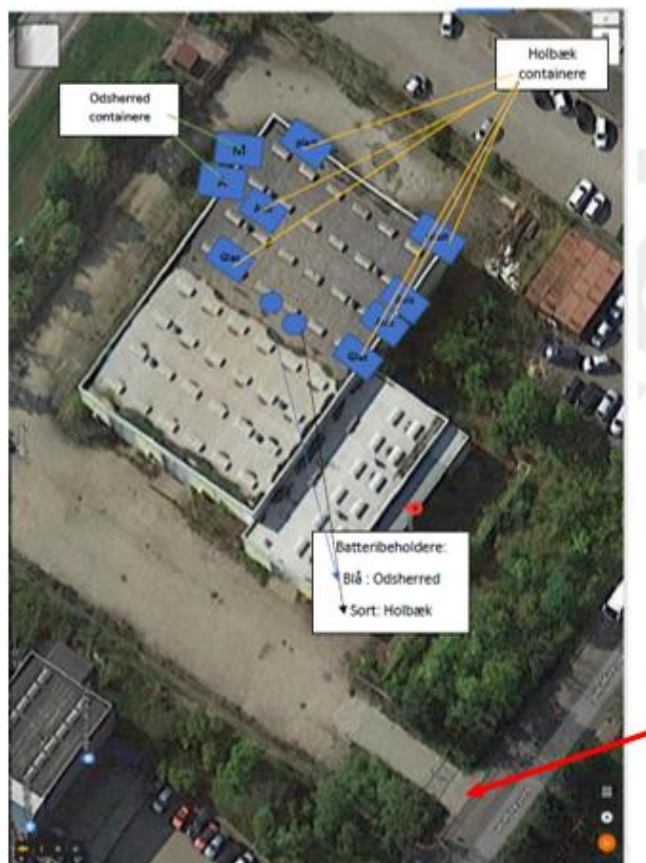
Figur 2: Oversigt med placering af containere - inde i og udenfor hallen

Virksomheden har udarbejdet en driftsinstruks, jf. vilkår 3, der skal sikre reglementeret modtagelse, omlastning, opbevaring og bortkørsel af modtaget affald, samt forholdsregler ved driftsforstyrrelser. I driftsinstruksen er der en aktivitetsoversigt, hvori tidsrum for kørsel på virksomheden fremgår.