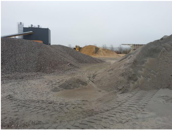
Foto 4: Viser den omtrentlige vestlige grænse af Etape1. Taget mod syd fra vejen midt gennem etapen.

Den vestlige grænse af Etape 1 fremgår af foto 4.