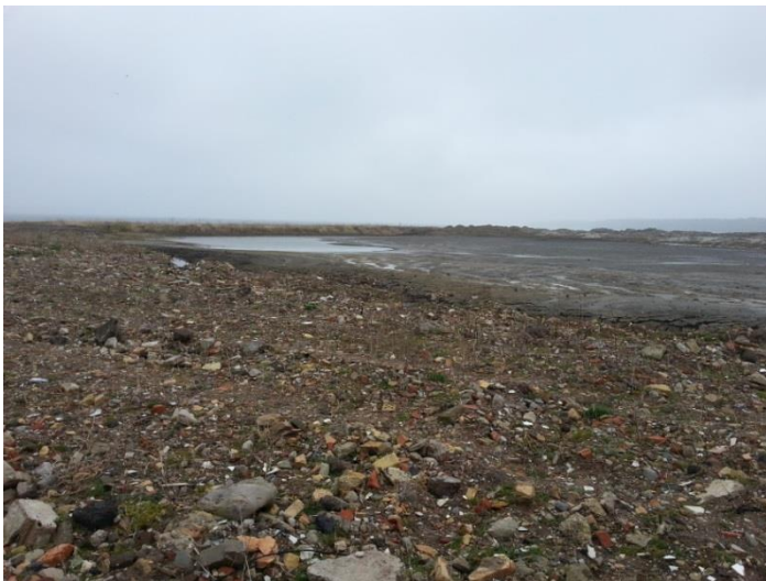
Foto 9: Den østligste del af Etape 2 med sidste del af opfyldningsbassinet, set mod øst.

Miljøstyrelsen ønsker oplyst, hvordan slutafdækningen af Etape 2 er tænkt. Horsens Havn oplyser, at der fjernes materiale til kote 2,5, opmåles kote med drone og lægges ren jord på til kote 3, hvorefter der måles med drone igen. Dette gælder for det store areal øst for Wittrup Seafood bygningen, se foto 9.