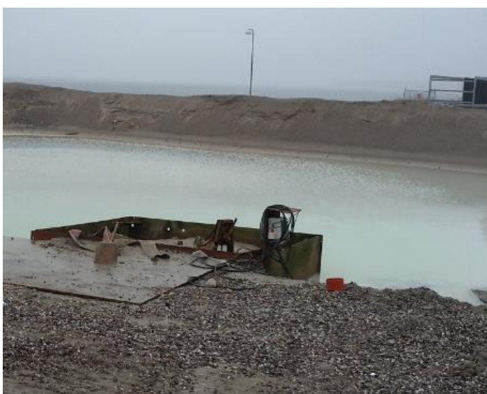
Foto 11: Sedimentationsbassin i det nordvestlige hjørne af Etape 2 set mod øst.

Miljøstyrelsen undersøger forholdet omkring sedimentationsbassinet på Etape 2, dvs. der udestår en afklaring.