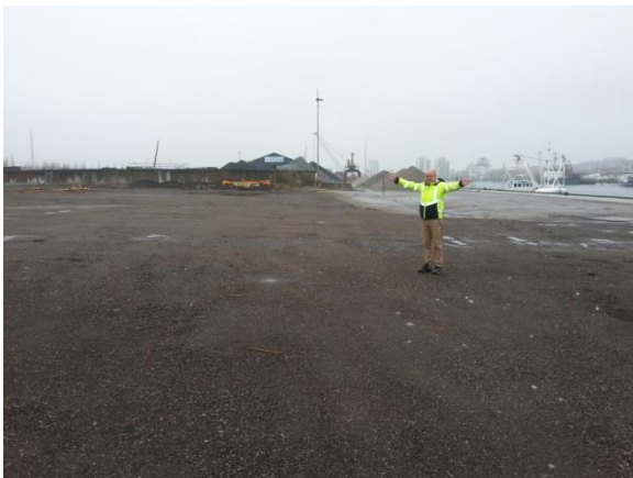
Foto 2: Cirka-markering af nordøstligt hjørne af Etape 1. Området er dækket af knust asfalt. Der ligger i dag en råstofvirksomhed på arealet, hvor der er placeret sorteringsmateriel.

Pga. udvidelse af havnekaj mod nord ligger det nordvestlige hjørne af Etape 1 nu inde på havnearealet, se foto 2.