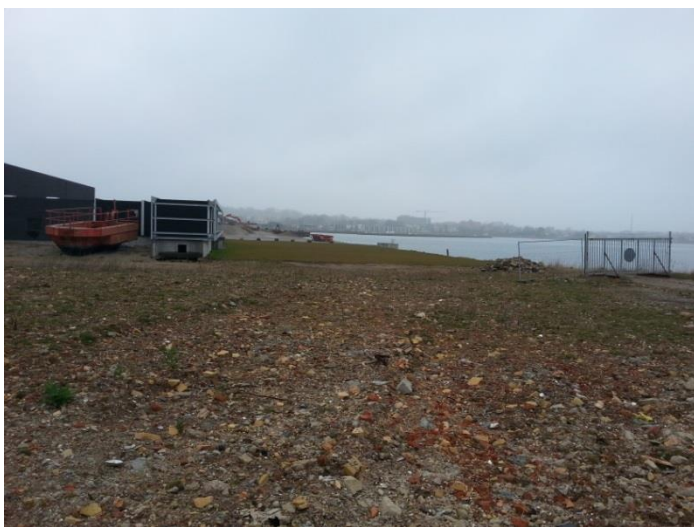
Foto 7: Hegn, græsplæne og sten ved nordlig indkørsel til indspulingsbassinet.