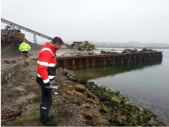
Foto 3: Nordøstlige ”knæk” på Etape 1 – nu inkluderet i nyt kajanlæg og afgrænset af spuns. Set mod nordvest.

Den etablerede havnekaj med spuns rammer den eksisterende dæmning ved etapens nordøstlig ”knæk”, se foto 3.