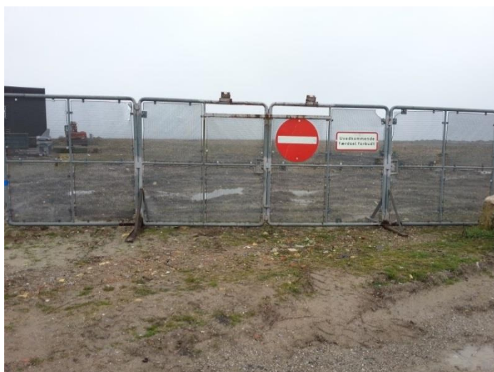
Foto 6: Hegn ved sydlig indkørsel til indspulingsbassinet (stillet til side i ansledning af tilsyn).

Horsens Havn oplyser, at der er hegn for indkørslen til Etape 2 både ved sydlig og nordlig tilkørsel. Hegnet på sydsiden var sat til side for at tilsynet kunne komme ind, se foto 6. Horsens Havn oplyser, at hegnet normalt står tværs over vejen. På nordlig side har det tidligere været muligt at køre ind, men denne vej er nu lukket med sten, græsplæne og et hegn, se foto 7.