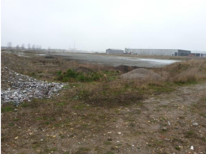
Foto 12: Den østligste del af Etape 2 med sidste del af opfyldningsbassinet, set mod vest med Wittrup Seafood bygningen i baggrunden. Til venstre ses bunker af ren jord rundt om bassinet.

blive brugt til slutafdækning, se foto 12. Allerede tilkørte mængder skal også registreres og afreporteres i årsrapport. Se endvidere punktet ”nedlukningsplan”.