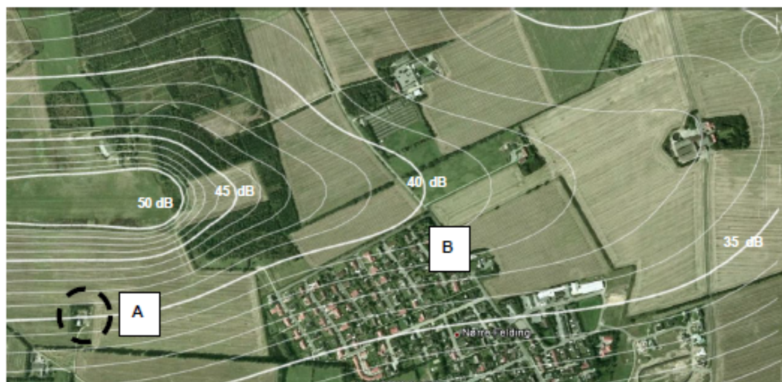
Figur 2 : Støjkurver over beboelse. Bemærk at nord ikke er opad.

På grundlag af beregningsforudsætningerne angivet i bilag 2, samt i tabellen ovenfor, er støjbelastningen L_{DEN} beregnet. Konturplot over området er vist på figur 1 og figur 2. For det åbne land er der i vilkår nr. 11 fastsat en støjgrænse på 50 dB(A) og for Nørre Felding, som må betegnes som boligområde, er støjgrænsen fastsat til 45 dB (A) .