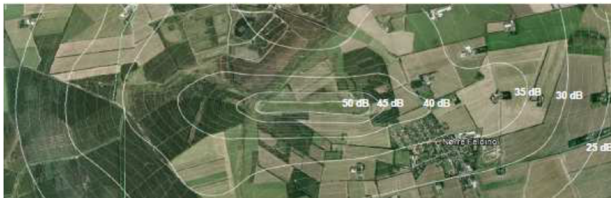
Figur 1 : Støjkurver over flyvepladsen. Der ligger ikke ejendomme indenfor 45 dB-konturen. Bemærk at nord ikke er opad.