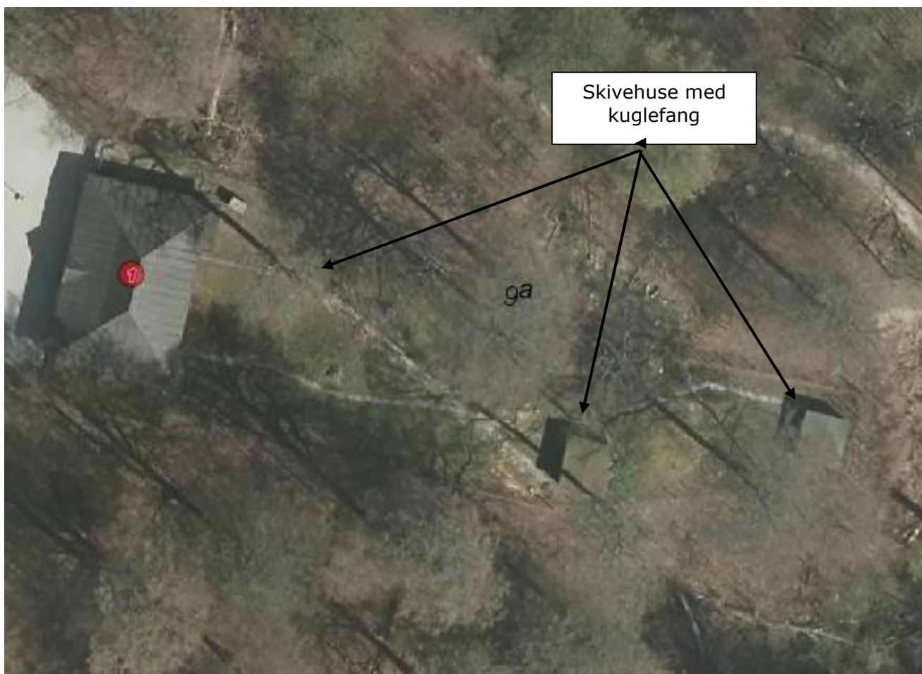
Luftfoto af skydebane øst for skovpavillon, anno 2019

Skydebanen er beliggende ved pavillon midt i Risskov på et ikke-selvstændigt matrikuleret areal ca. 170 meter SV for Sjette Frederiks Kro (se fig. 1). Anlægget ligger i område 04.02.01 RE, som er udlagt til offentlige rekreative formål.