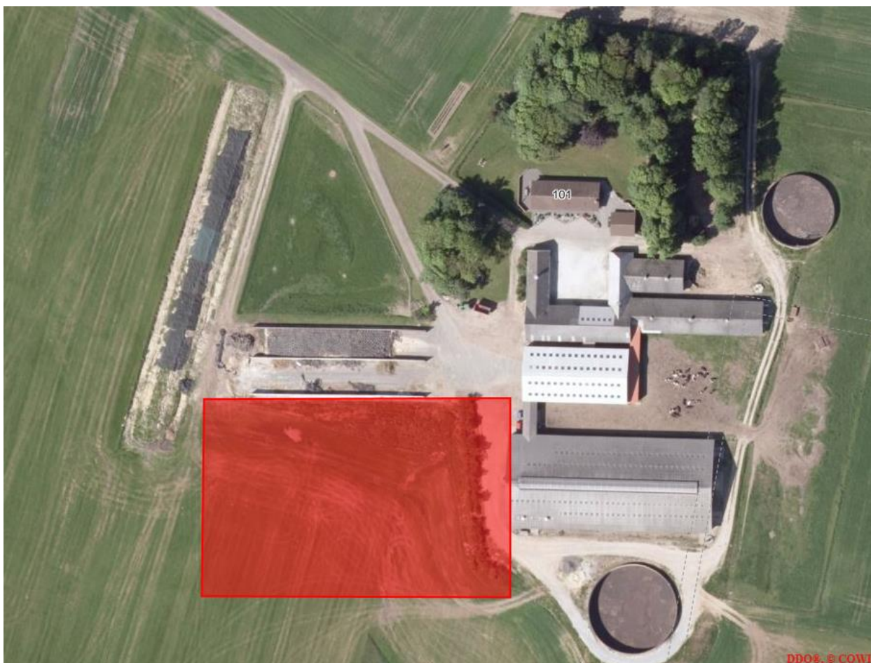
Anlægstegning, beliggenheden af den nye plansilo er markeret med rød

Der er søgt om opførelse af ny plansilo. Plansiloen er projekteret til at blive ca. 5.700 m 2 stor og skal placeres syd for den eksisterende silo og vest for kostalden, som det ses af tegningen nedenfor.