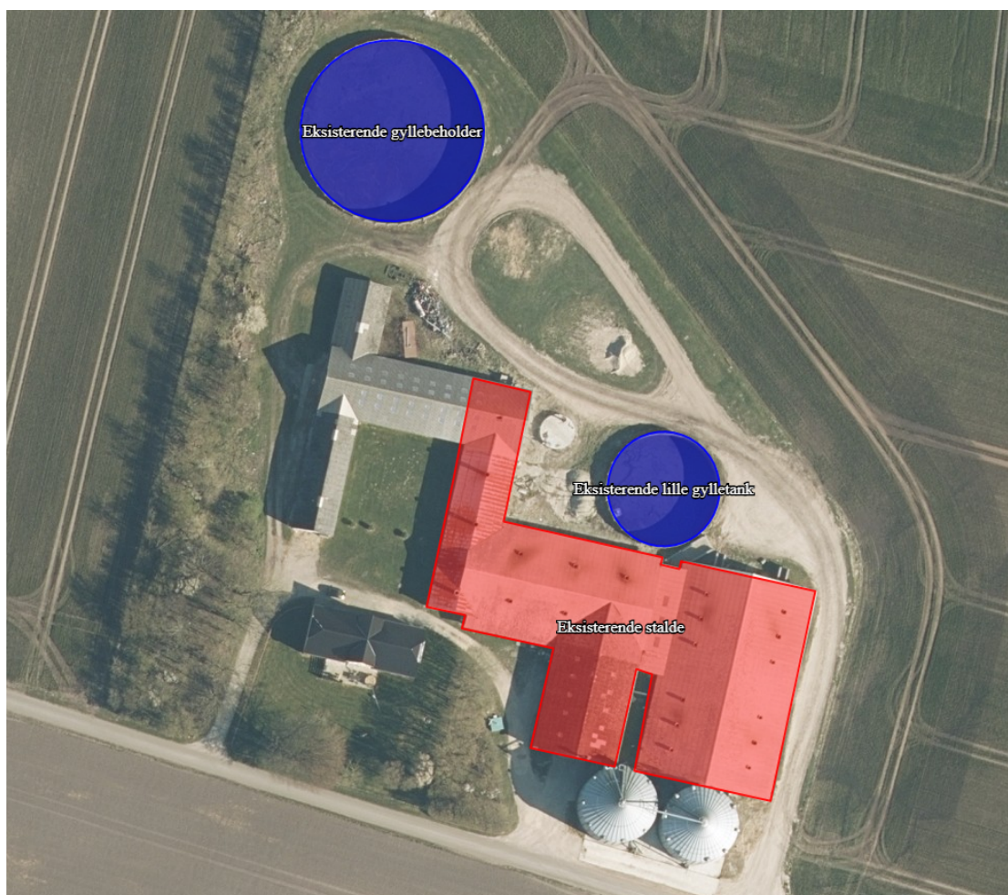
Figur: Indtegning af stalde og gylletanke på Langbrovej 39 i revurderingsskema 227259

EU offentliggjorde en BAT-konklusion i 2017, og alle IE-brug skal derfor revurderes nu, så fristen den 21. februar 2021 kan overholdes.