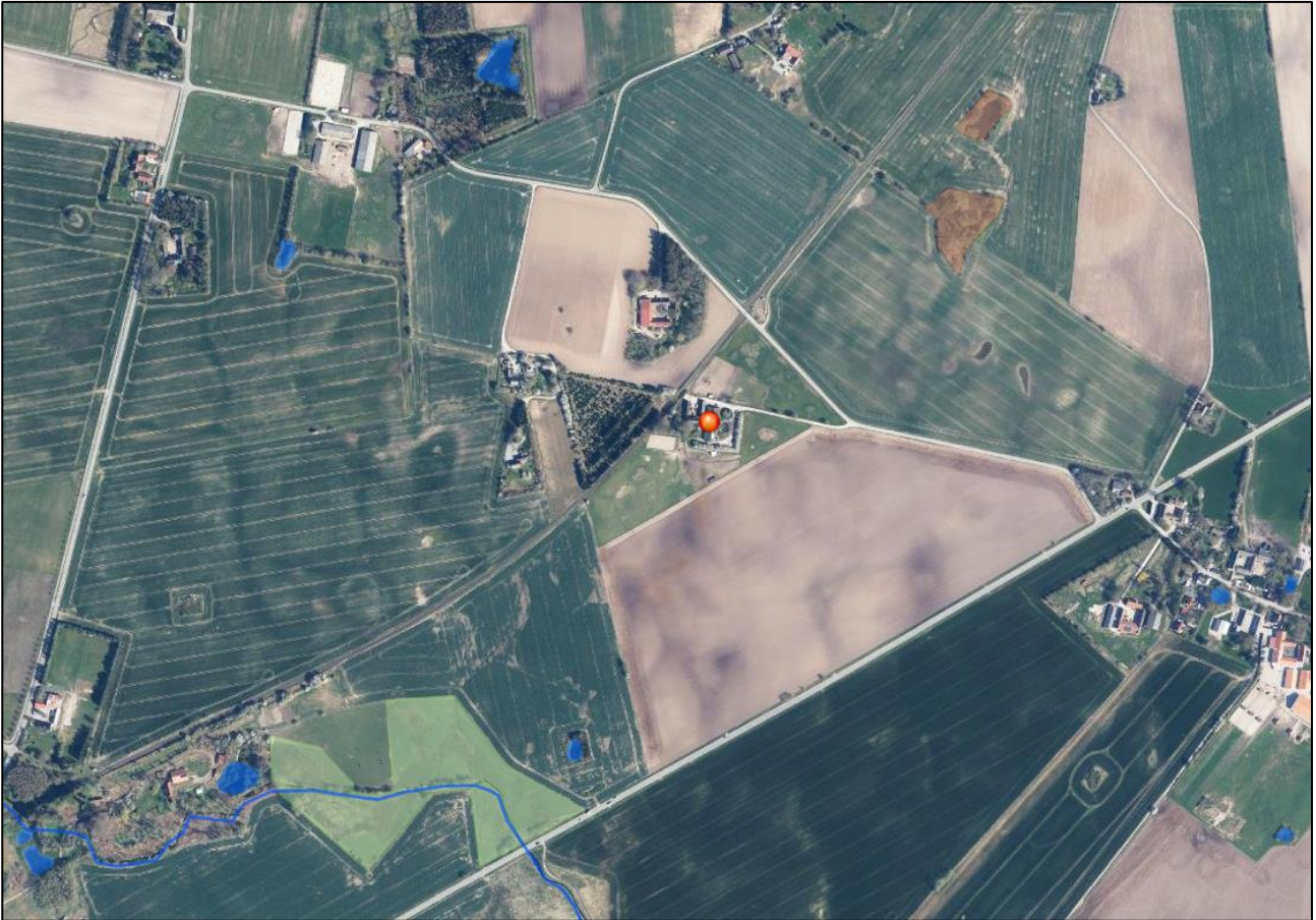
Figur 3. Placering af nærmeste kategori 3 og § 3 natur nær ejendommen. Kategori 1 og 2 natur er placeret længere væk. Ejendommen er markeret med en rød prik.