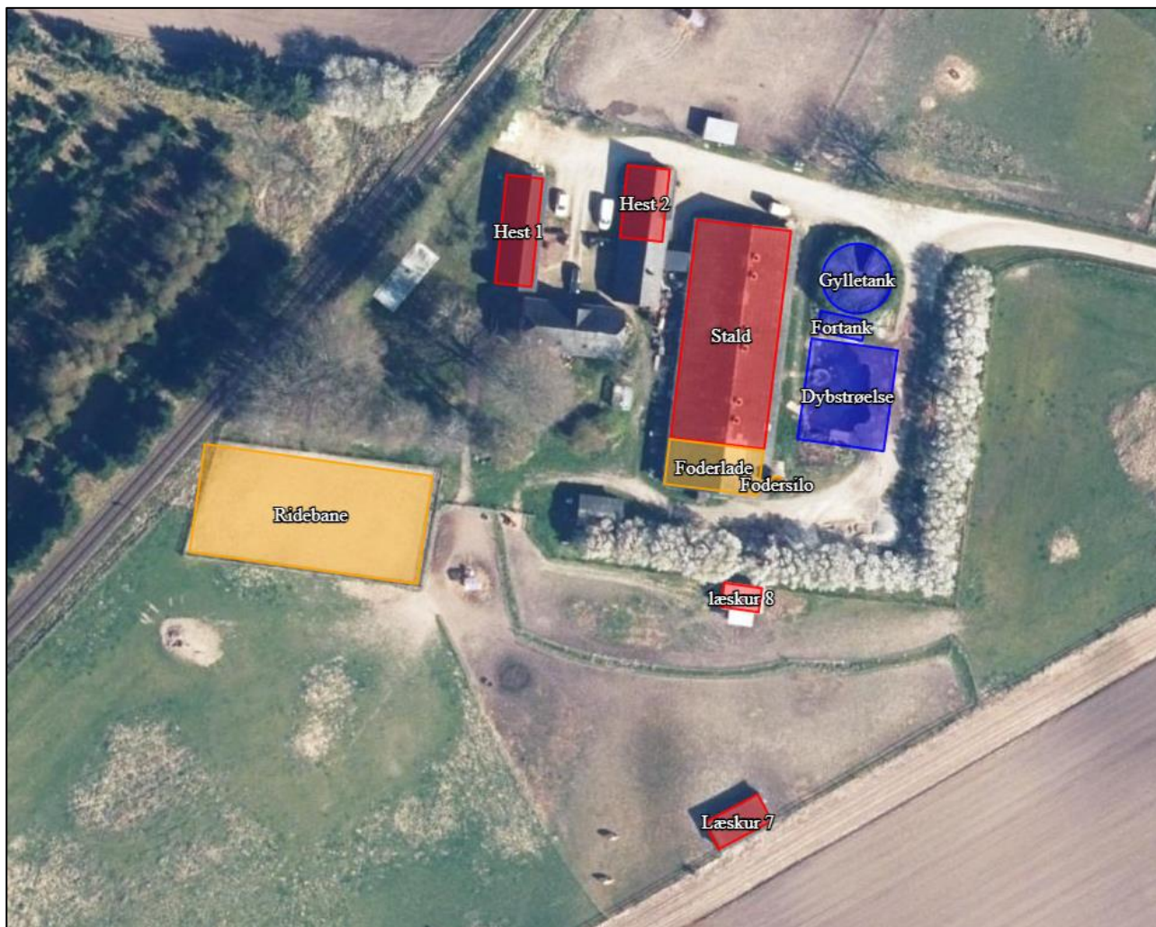
Figur 1. Oversigt over ejendommens staldafsnit og produktionsanlæg.

Der gøres opmærksom på, at de staldarealer, der ikke indgår i produktionsarealet, såsom ridebanen og udleveringsområdet til svinestalden, skal rengøres som beskrevet i godkendelsesbekendtgørelsen § 45.