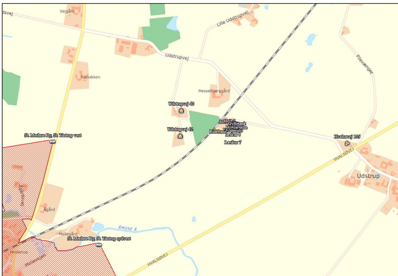
Figur 2. Placering af de to nærmeste naboer uden landbrugspligt og byzone.

Figur 2 viser de to nærmeste naboer uden landbrugspligt, samlet bebyggelse, lokalplan og byzone. Lugtgenafstandene bliver overholdt for dem alle.