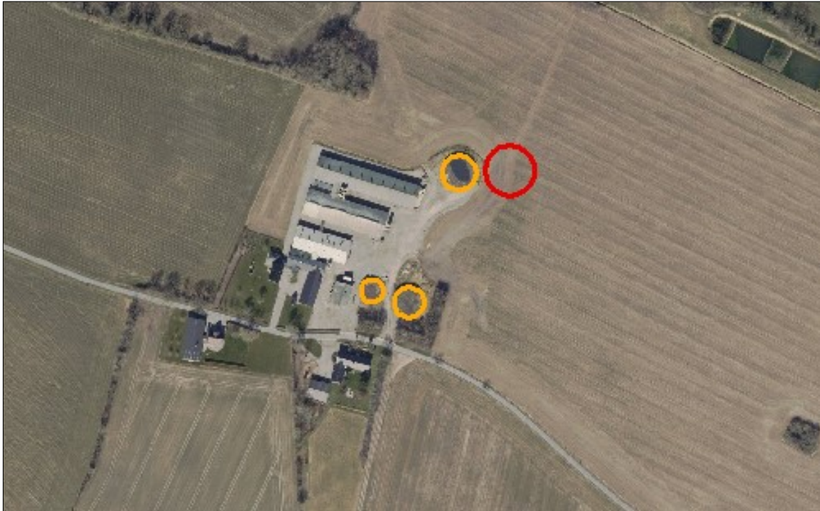
Figur 1. Det røde markerer den ansøgte gyllebeholder.

Placering af gyllebeholderen kan ses på nedenstående figur.