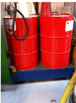
Billede 3: Tønder med diverse olier

Der stod en del dunke med olier ved siden af de røde tønder, billede 3. Større dunke skal opbevares i henhold til forskriften, så væske ikke kan løbe hen til porten i tilfælde af lækage. Kemikalier, der ikke skal bruges, skal afleveres til godkendt modtager, f.eks. på genbrugspladsen eller Avista Oil.