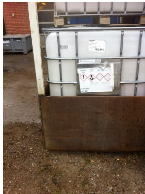
Billede 2: Udendørs pallettanke

Hvor der var mulighed for spild af olier ved CNC-maskinerne, var der lagt en slange med absorberende materiale rundt om stedet, således at et eventuelt spild ikke kunne løbe ud over hele gulvet. Disse slanger bliver hentet, rensset og returneret af Berendsen.