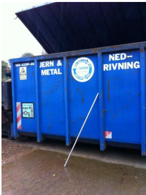
Billede 1: Container med jernspåner