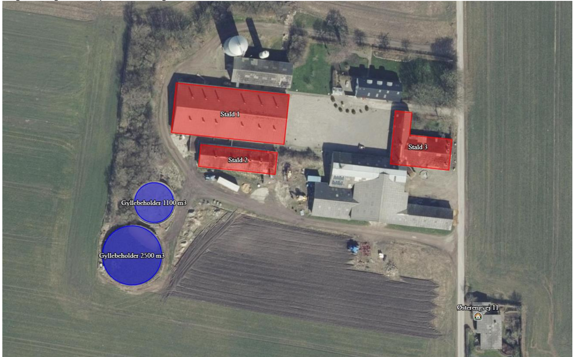
Bilag 2. Oversigtskort over produktionsanlæg