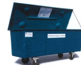
Aflang beholder (lån)