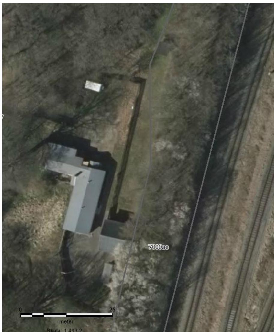
Fig. 1 Skydebanens placering, luftfoto anno 2016

Skydebanen er beliggende inderst i vinklen mellem de nord- og sydgående jernbanelinjer fra Aarhus Hovedbanegård i område 12.00.03.NA, som er udlagt til jordbrugs- og naturformål (se fig. 1). Nærmeste støjfølsomme område er etageboliger knap 200 meter SØ for skydebanen og kolonihaver ca. 325 meter mod NV.