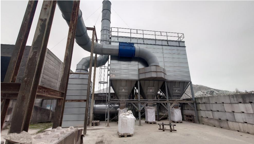
Et af de udendørs filteranlæg