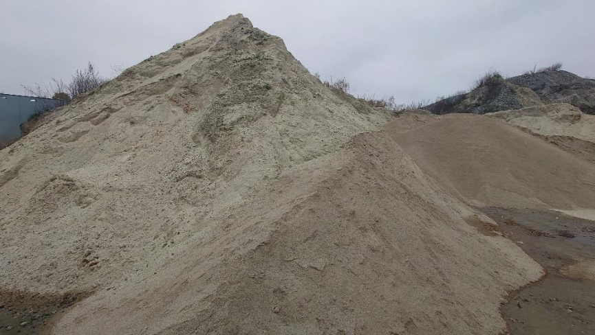
0 til 2 mm fraktion som går til MUCK i Hedehusene