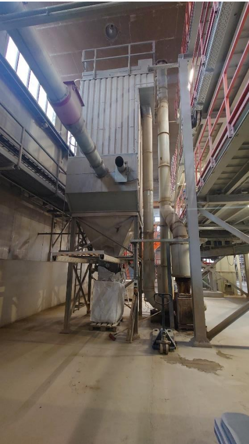
Indendørs filter ifm. tørreovnen