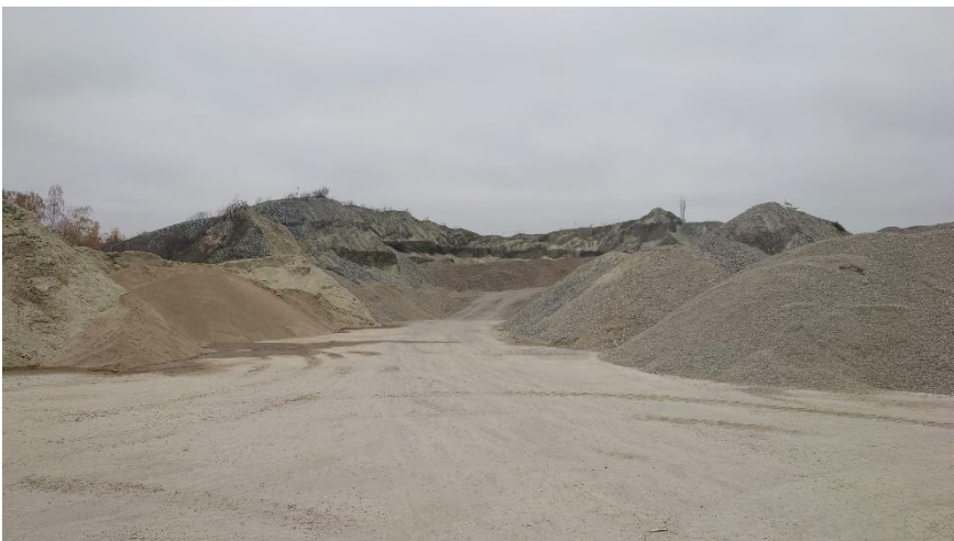
Resterne – ca. 30.000 tons Rejekt fra Holmegaard - halvbueformet bunke i midten og bagerst på billedet.