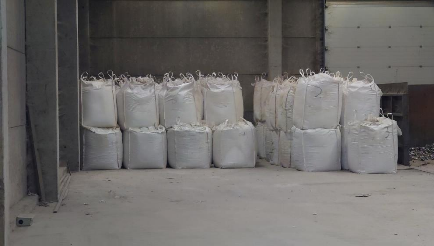
Indendørs oplag af filtermateriale