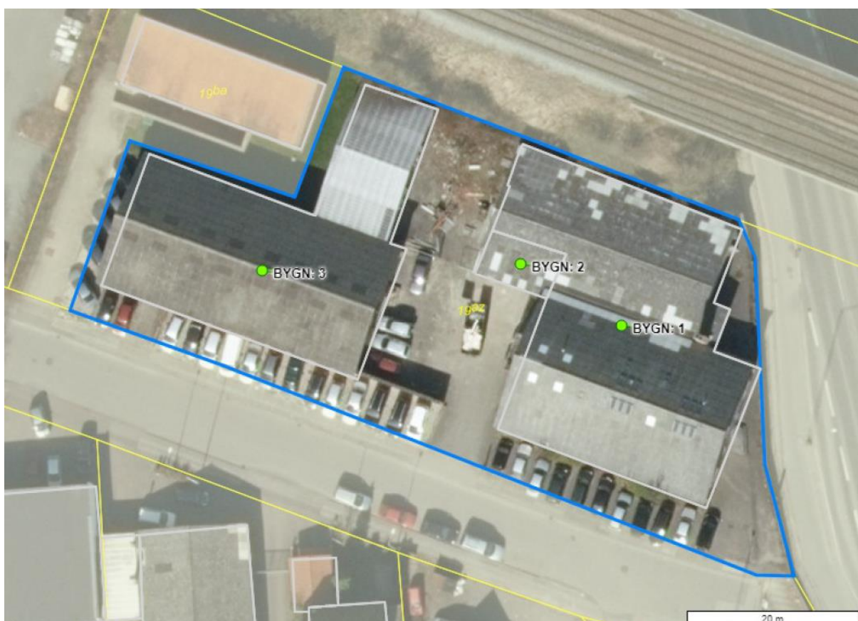
Luftfoto med virksomhedens beliggenhed og matrikelskel

I forhold til kommuneplanen ligger virksomheden i område 150513ER, der er udlagt til erhverv, og som er omfattet af lokalplan 116.