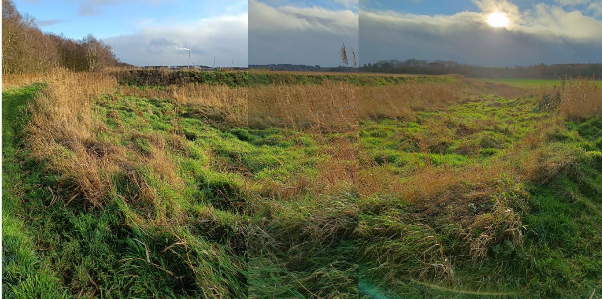
Figur 8.: Billede taget fra nordvestlige hjørne af Stånum. S sammensat af 3 billeder. Det forreste viser den resterende lave digekrone, hvor det originale dige stod, og bagest ses det nye dige.