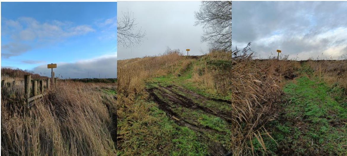
Figur 9.: Skilte og hegn opsat omkring deponierne billederne er fra Stånum og Drastrup Kær.

På tilsynet kunne det konstateres, at skiltning og hegn ved tilgangsveje var i orden, se figur 9. På depoternes nordlige side (ud mod fjorden), var der etableret lavninger i diget til indspulingsrøret, se figur 10. Det aftaltes, at Randers Havn får etableret kædeafspærring ved lavningerne i diget og fremsender fotodokumentation heraf senest d. 14. januar 2022 til Miljøstyrelsen.