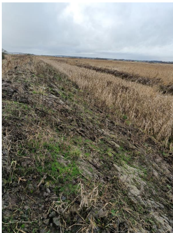
Figur 7.: Billede taget fra det sydøstlige digehjørne mod vest på Drastrup kær.