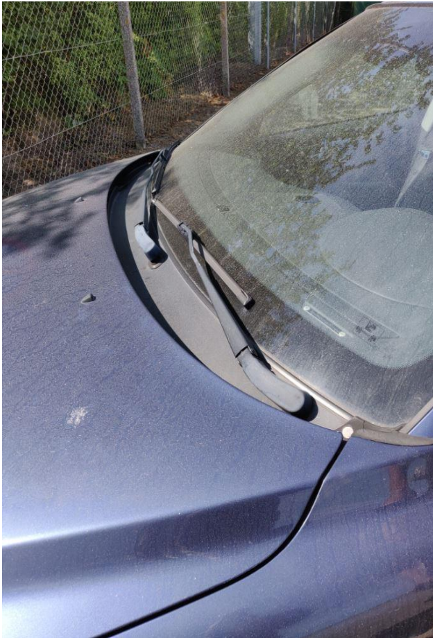
Billede 1a Kornstøv på bil.