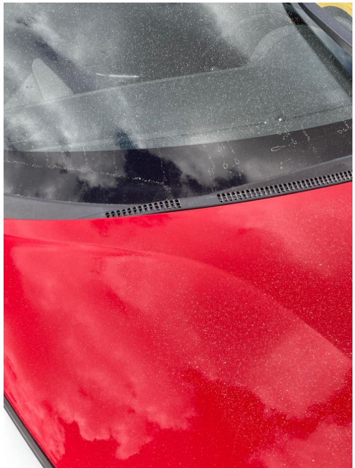
Billede 1b Kornstøv på bil.