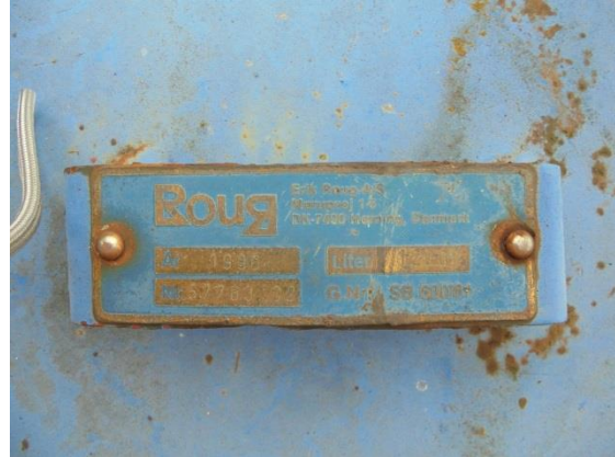
År: 1996, liter: 1200, Nr.: 57763-02