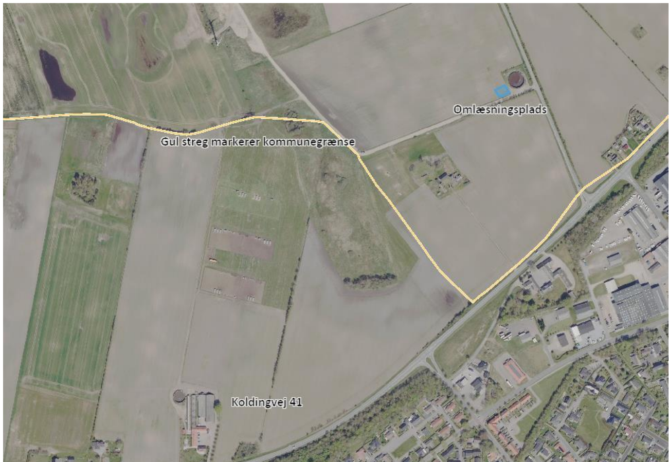
Figur 1. Placering af omlæsningspladsen i forhold til ejendommen.

Der ansøges om etablering af en omlæsningsplads til dybstrøelse i forbindelse med levering af dybstrøelse til biogasanlæg. Omlæsningspladsen er placeret i tilknytning til gyllebeholderen på matr. nr. 28, Gejsing By, Andst tilknyttet ejendommen Koldingvej 41 jf. nedenstående kort.