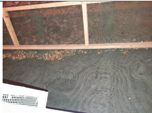
Foto 4 Patronfangernet