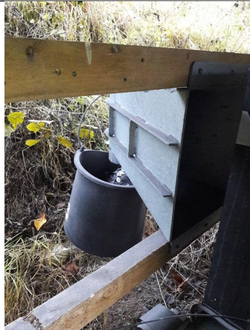
Foto 2 cyklonbanefan ved 50 meter banen