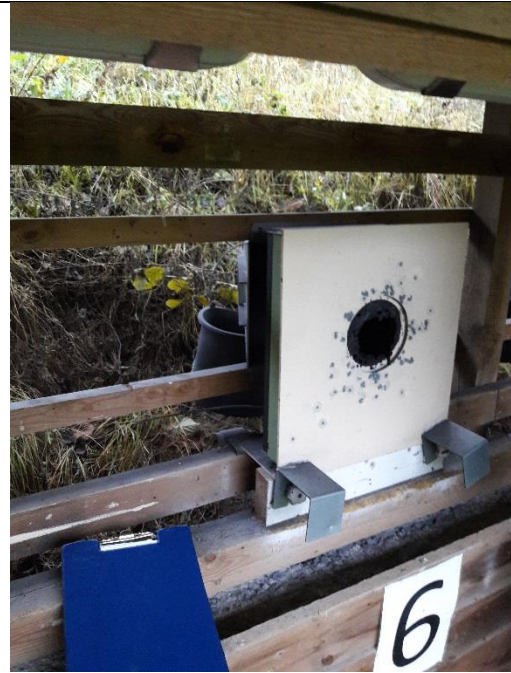
Foto 1 cyklonbanefan ved 50 meter banen