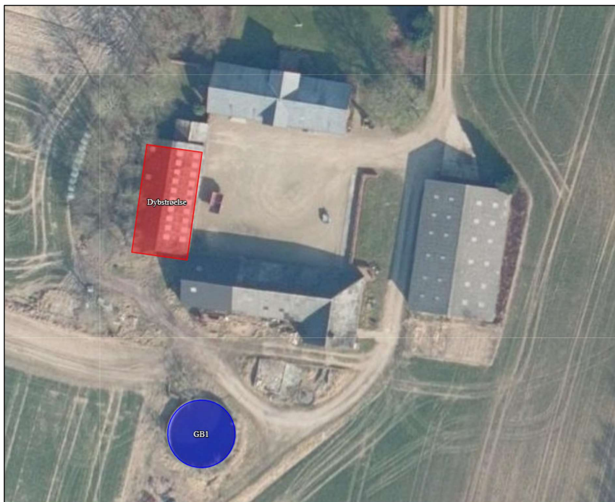
Figur 2-1 Placering af stald og gødningslagre

Der er søgt om at etablere et nyt kvæghold på dybstrøelse i en eksisterende stald på Oksevejen 9, 8680 Ry. Se figur 2-1.