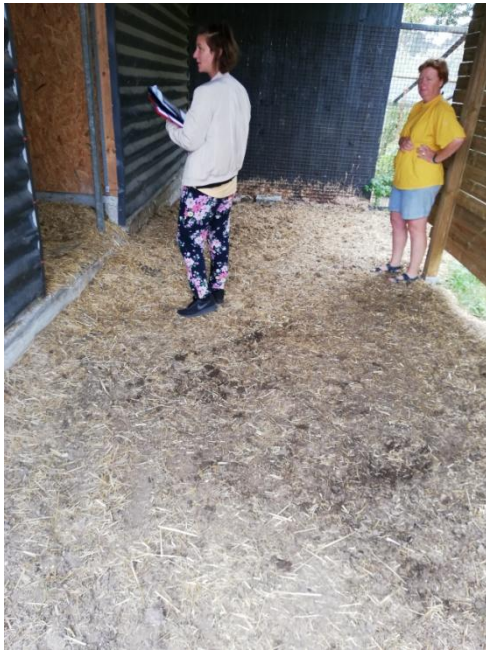
Figur 4: Stald for heste med areal uden fast belægning