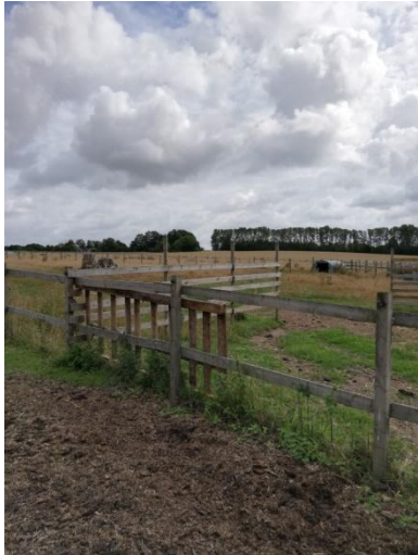
Figur 6: Flytbare læskure mere end 25 meter fra drikkevandsboring