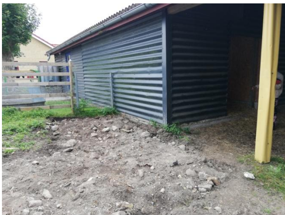
Figur 5: Hestestald mindre end 25 meter fra egen drikkevandsboring