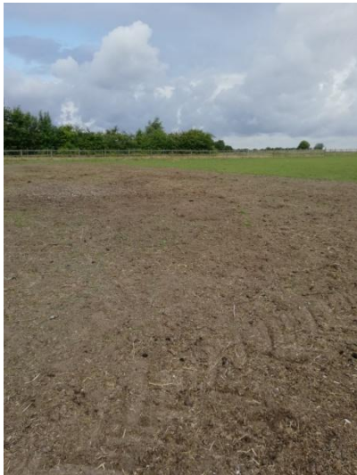
Figur 7: Fold ved bebyggelsen med nedfældet kompost i forsommer 2019