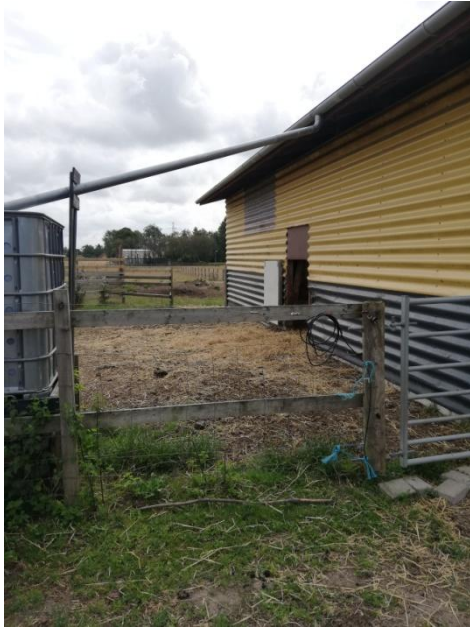
Figur 3: Stald for Dexter-køer samt opsamling af regnvand