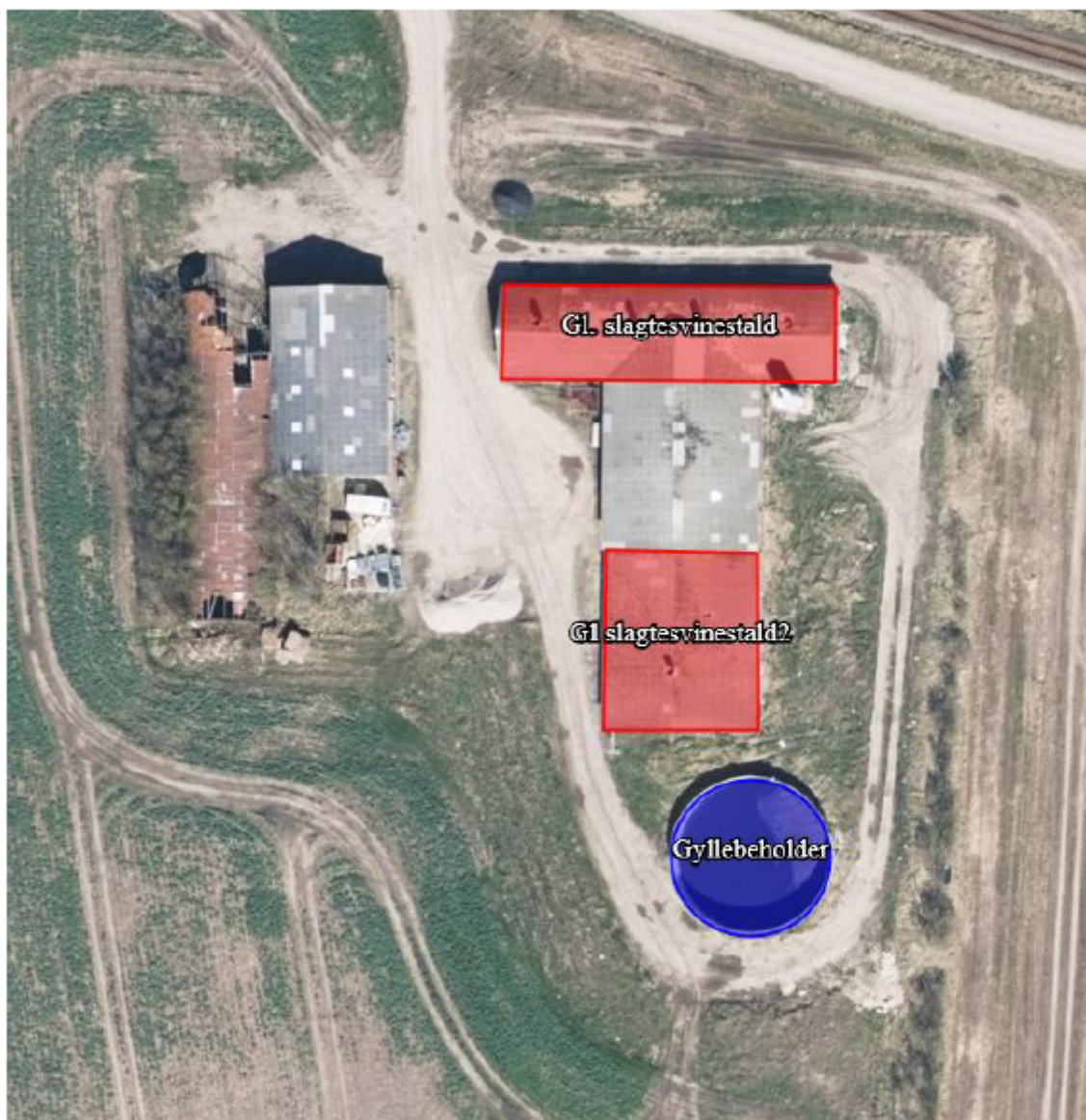
Mellemvej 17, 7790 Thyholm