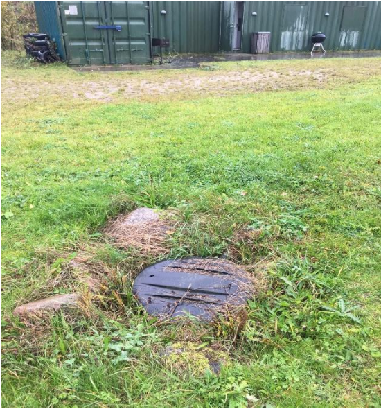
Toppen af tank til spildevand