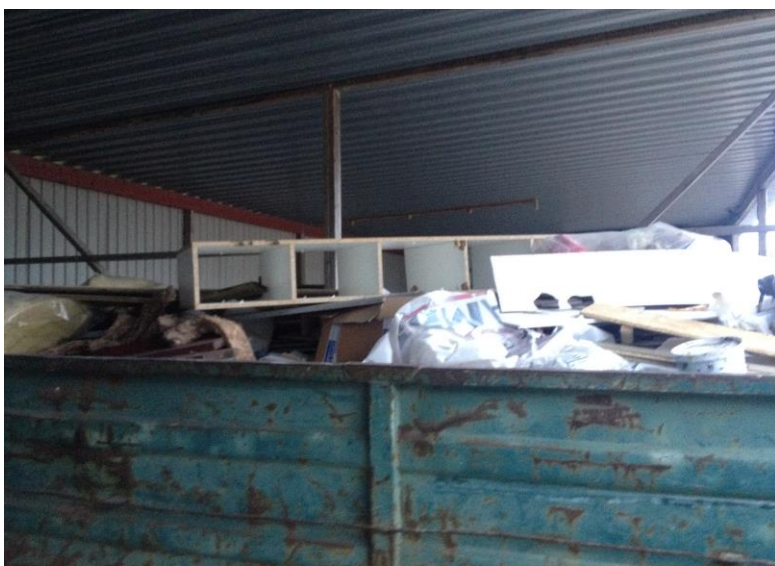
Billede 1. Container indholdende pap, papir, plastic, metal, dele af en reol og malerbøtter.

Ved tilsynet blev der dog observeret, at der blev opbevaret forskellige former af affald i en container, som ikke kun var blandet bygnings- og nedrivningsaffald. I containeren blev følgende affaldsfraktioner observeret: pap, papir, plastic, metal, dele af en reol og malerbøtter. Affaldet var ikke kilde-sorteret, som beskrevet i affaldsbekendtgørelsen og. I dagrenovationscontaineren kunne der endvidere observeres en stiksav, øldåser samt batteriopladere.