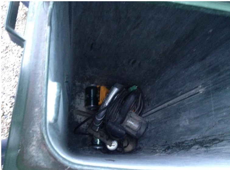
Billede 2. Billede af dagrenovationscontaineren der indholdt en stiksav, øldåser samt batteriopladere.

Ovenstående affaldsoplag på virksomheden er en overtrædelse af affaldsbekendtgørelsens § 64, hvor der står, at affaldsproducerende virksomheder skal kildesortere deres affald.