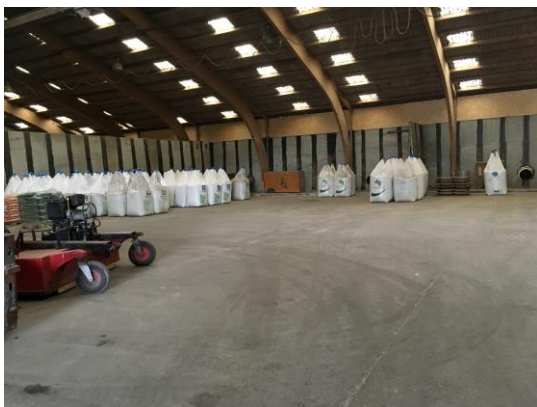
Billede 2. Bigbags

Der var på tilsynsdagen næsten tomt i hallerne. Der var et lille oplag af gødning i bigbags og et lille oplag korn, se billeder nedenfor. Det vurderes at opbevaring sker på en miljømæssig forsvarlig måde.