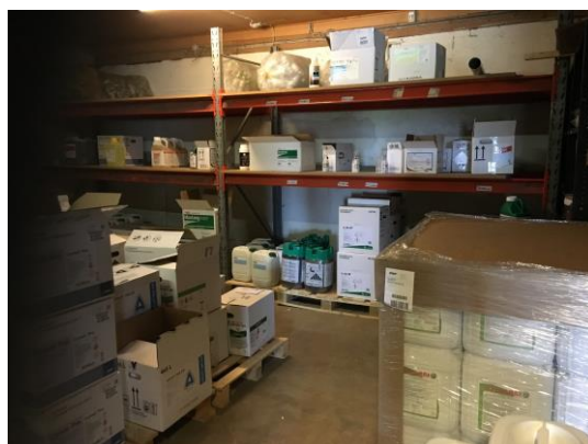
Billede 1. Kemirum

Olie til salg opbevares i små dunke i butikken. Kemikalier til salg opbevares i aflåst rum med støbt gulv uden afløb. Se billede nedenfor. Det vurderes at opbevaring sker miljømæssig korrekt. Der er serviceaftaler på virksomhedens maskiner, så der opbevares ikke spildolie.