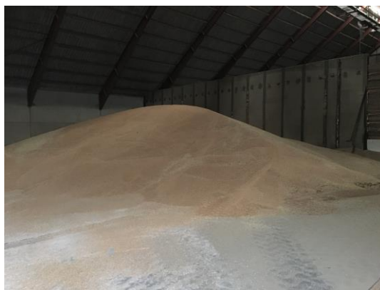
Billede 3. Oplag af korn

Virksomheden har en opbevaringskapacitet på: