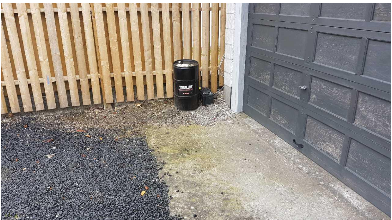
Spildolie og akkumulator var opbevaret uden spildsikring. Dette blev dog straks flyttet.