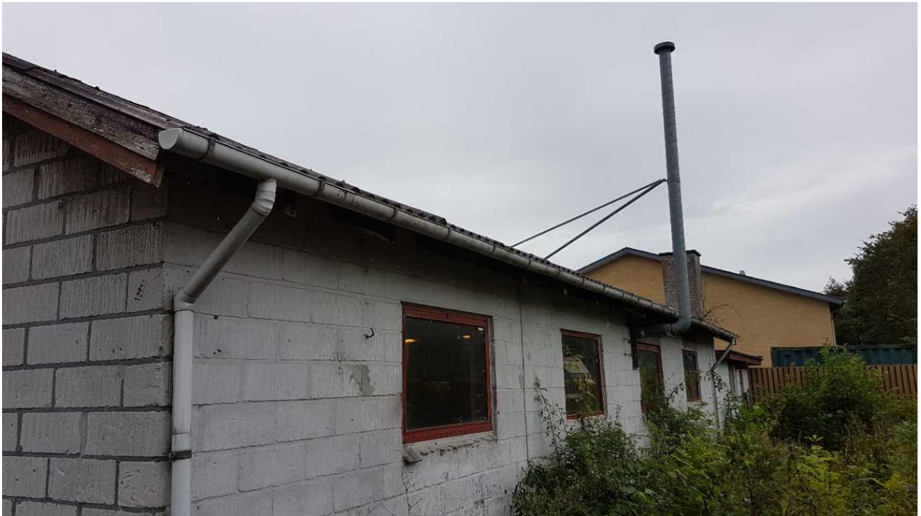
Afkast fra punktudsugning til svejsning og udstødningsgas.