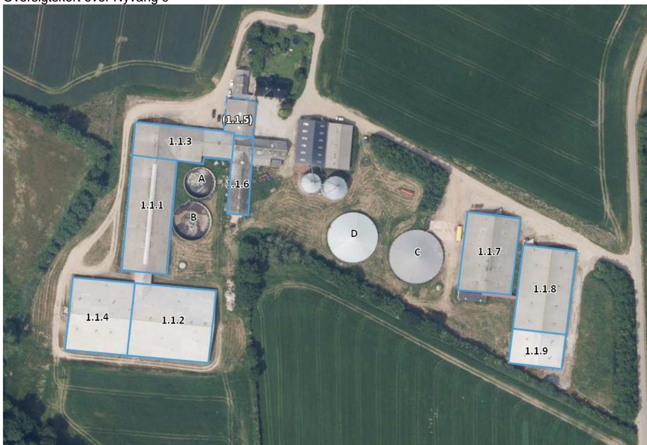
Oversigtskort over Nyvang 9

Denne revurdering tager udgangspunkt i ejendommens gældende godkendelse og tillæg og bygger på oplysninger fra virksomheden selv og miljøtilsyn. Beregninger er foretaget via www.husdyrgodkendelse.dk som revurderingsskema nr. 219092. Revurderingen giver ikke tilladelse til at øge eller ændre dyreholdet, og der er derfor ikke tale om nogen merpåvirkning af omgivelserne.