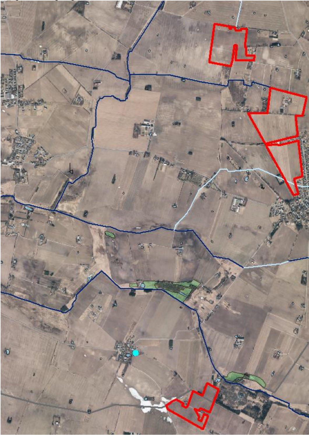
Udbringningsarealer og § 3 natur