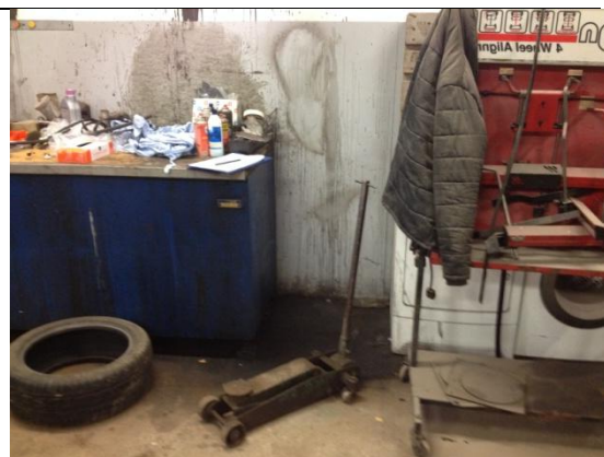
Foto 2 Spildeolie tank m spildevand på gulv og væg