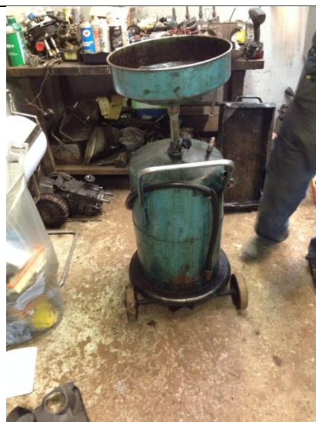
Foto 6 Beholder til opsamling af olier mv.