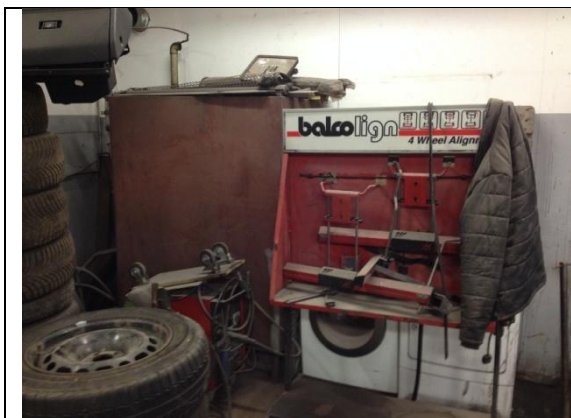
Foto 1 overjordisk tank til oliefyr