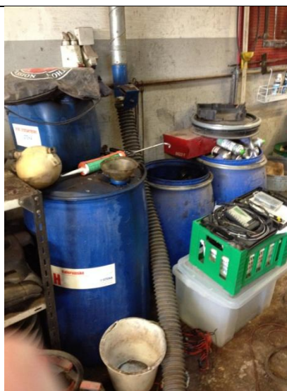
Foto 4 tromler til spraydåser mv.