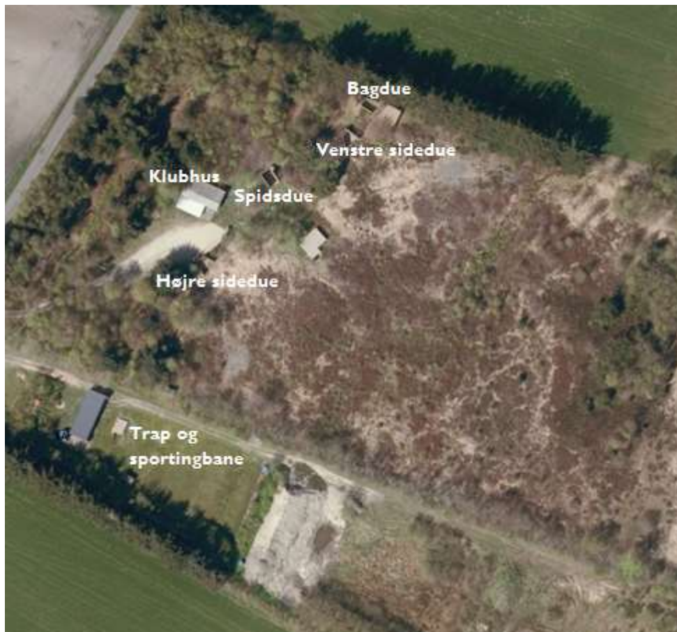
Figur 2: Indretning af skydebanen.

Kastemaskiner er placeret, så der ikke sker nedslag af lerdUER på dyrkede områder. Der stilles vilkår om, at kastemaskiner skal opstilles, så nedslag af lerdUER kun sker på det til skydebanen hørende udyrkede areal samt hovedsagelig inden for det primære nedfaldsområde. Arealet må ikke anvendes til dyrkning. Dette er et standardvilkår.