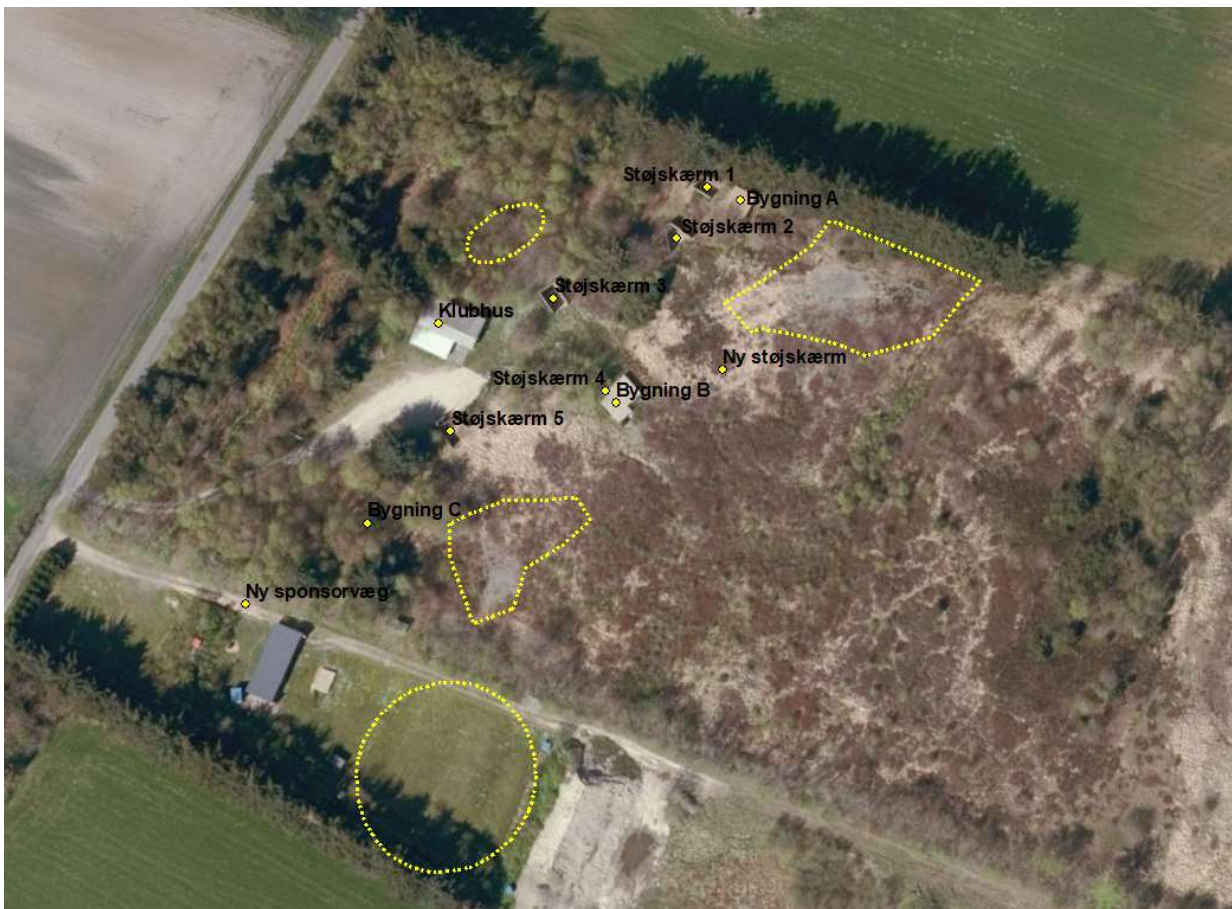
Figur 3: Kort over støjskærme og nedfaldsområder. De primære nedfaldsområder er markeret med gult.

Jagtforeningen har sammen med ansøgningen om miljøgodkendelse indsendt en støjberegning, hvor alle de nye støjdæmpende tiltag er medregnet. Af støjberegningen ses det, at det maksimale A-vægtede lydtryksniveau med tidsvægtning I (impuls) af enkeltskud ved den mest støjbelastede bolig (Herringvej 47, 6870 Ølgod) er beregnet til 66,0 dB(A)I.