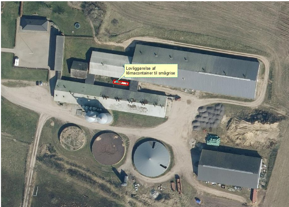
Figur 1. Oversigt over bygninger på Torlundvej 5.