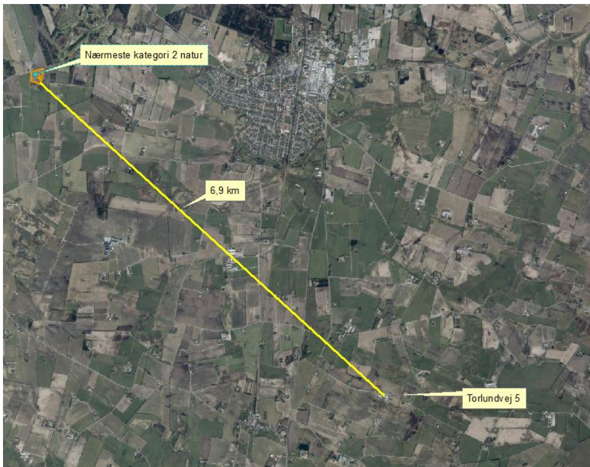
Figur 4. Afstand fra Torlundvej 5 til nærmeste kategori 2 natur.

Varde Kommune vurderer, at lovliggørelse af en klimacontaineren ikke vil påvirke nærliggende naturområder.