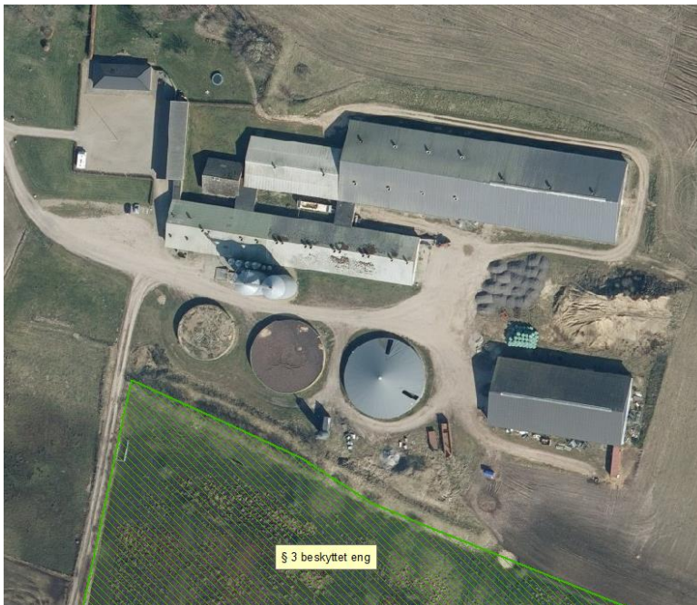
Figur 2. § 3 beskyttet eng syd for Torlundvej 5.