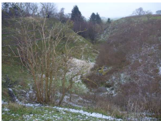
Fig. 1 Stier efter de græssende får ses på skråningerne