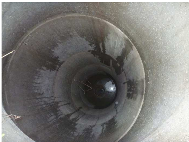
Fig.4: I denne perkolatbrønd stod perkolat op over drænrøret, hvilket giver mistanke om, at drænrøret er stoppet et sted nedstrøms brønden.