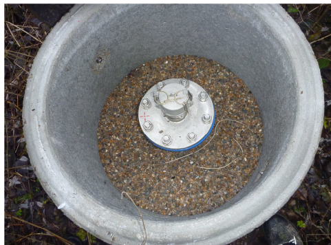
Fig. 2 Kontrolboringer er renoveret og indmålt

Virksomheden har i 2017 meddelt, at man har sløjftet boring A (DGU nr. 192.1196) og grundvandsboring E (DGU nr. 192.1159), da de ikke længere indgår i monitoringsprogrammet.