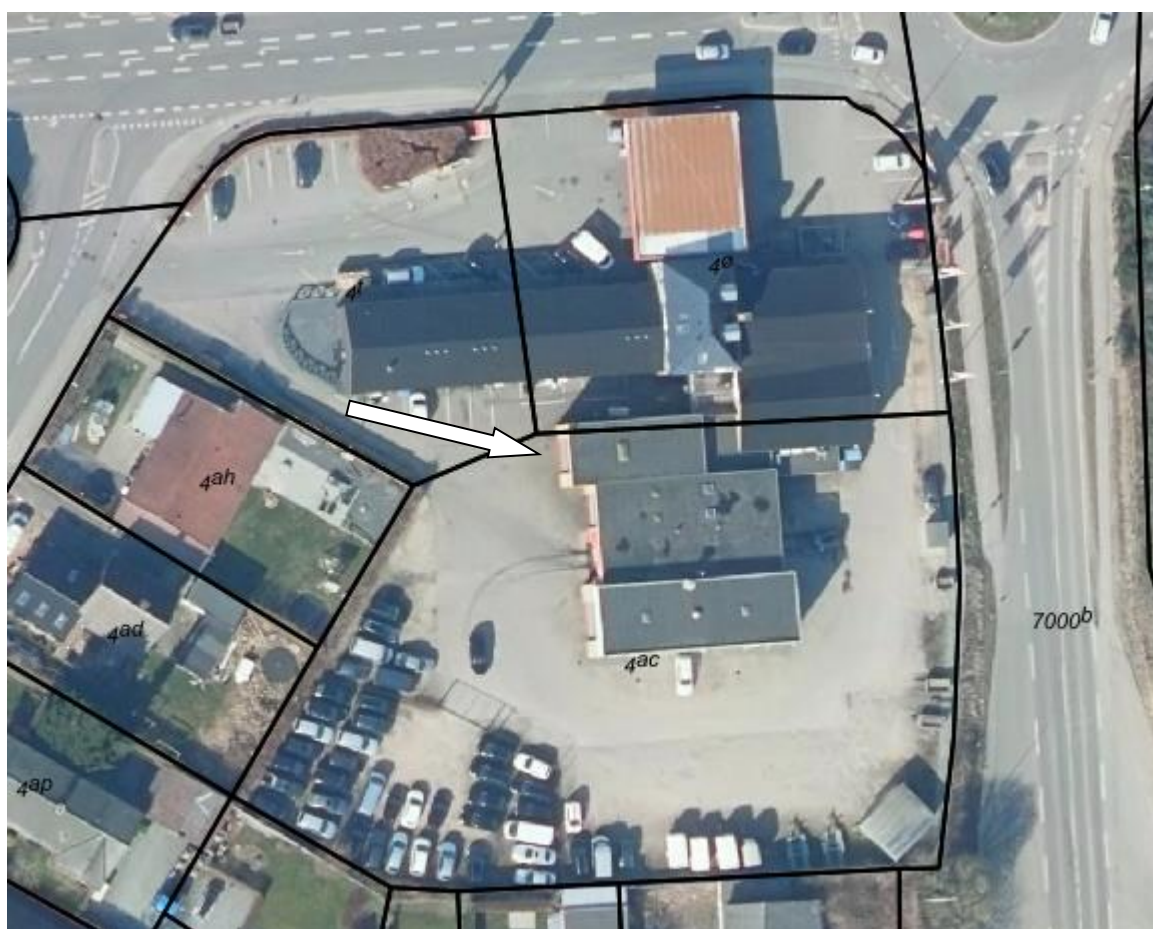
Bent Jensen Automobiler markeret med pil. Luftfoto 2022