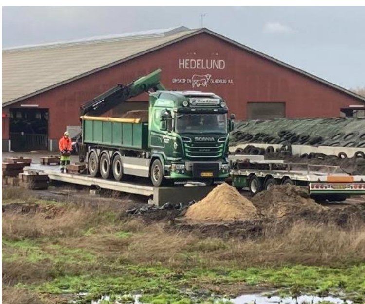
Figur 2. Brovægten på Debelvej 51, jævnfør produktblad 48,5 cm over terræn. Figur udarbejdet af ansøger.