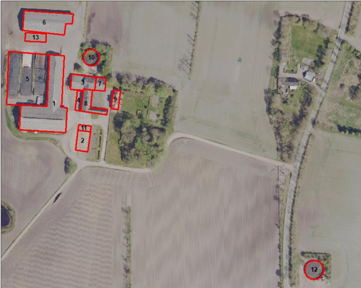
Figur 1. Husdyrbrugets driftsbygninger.