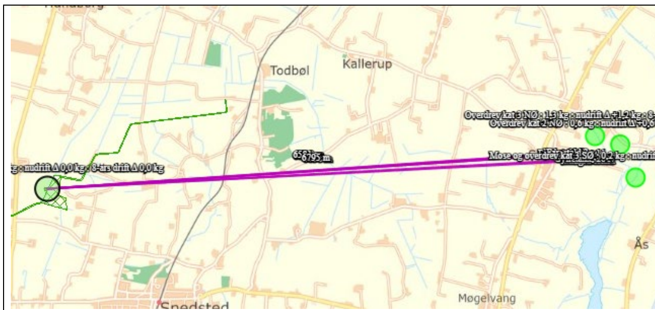
Nærmeste kategori 1-natur

Der er ikke vurderet på kumulation, da det mest skærpede beskyttelsesniveau for kategori 1-natur er overholdt (0,2 kg NH 3 -N/ha/år), det vil sige beskyttelsesniveauet, hvor der er kumulation med 2 eller flere husdyrbrug. Dermed er depositionskravet for kategori 1-natur overholdt.