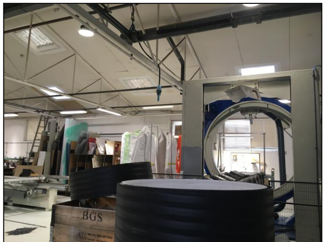
Foto fra produktionshallen