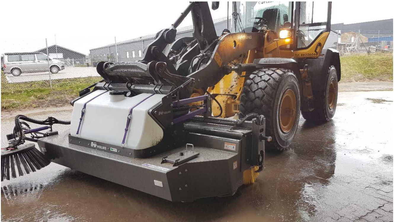
Den nye fejmaskine.