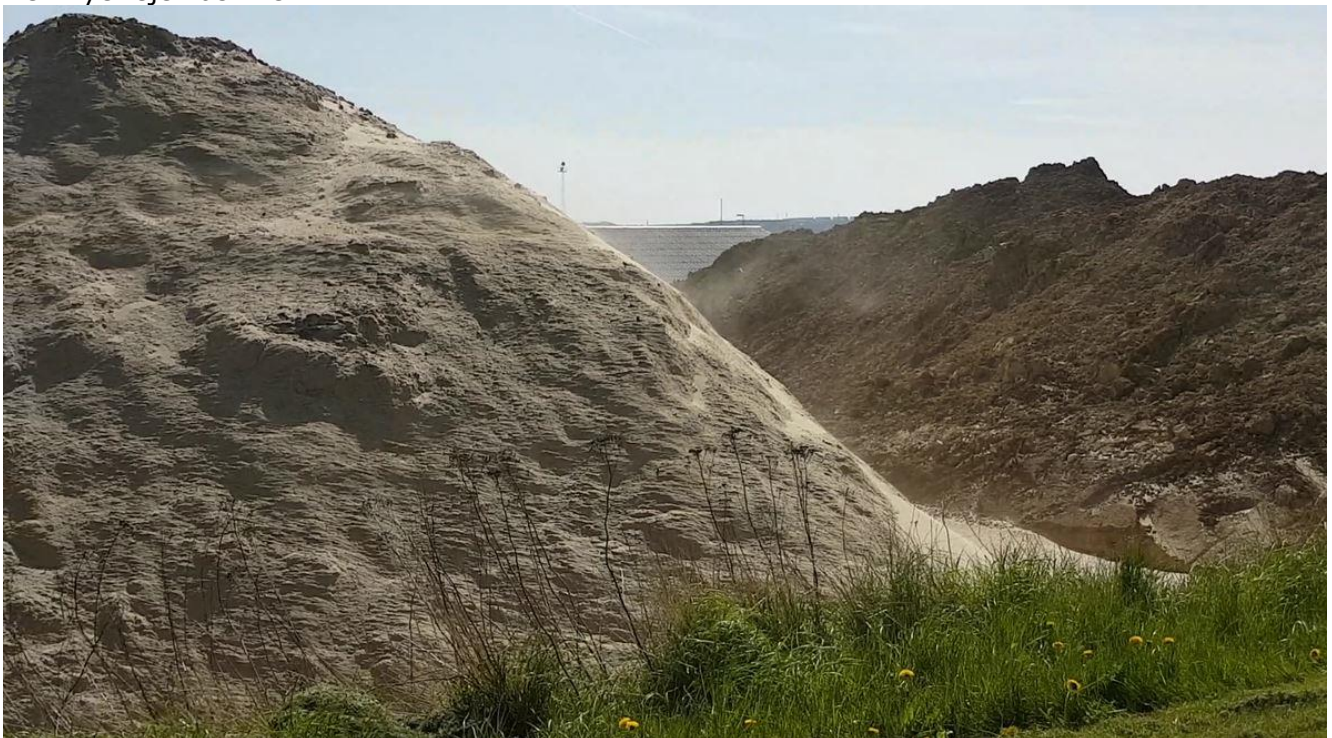
Oplag med sandflugt den 2. maj 2017.