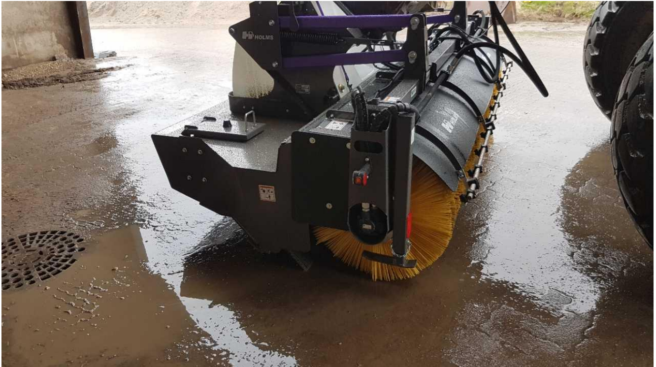
Den nye fejmaskine.