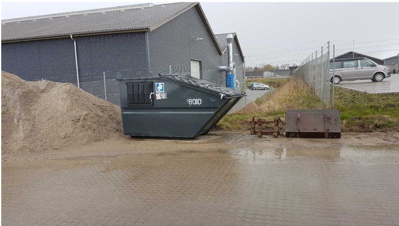
Container til brændbart erhvervsaffald.