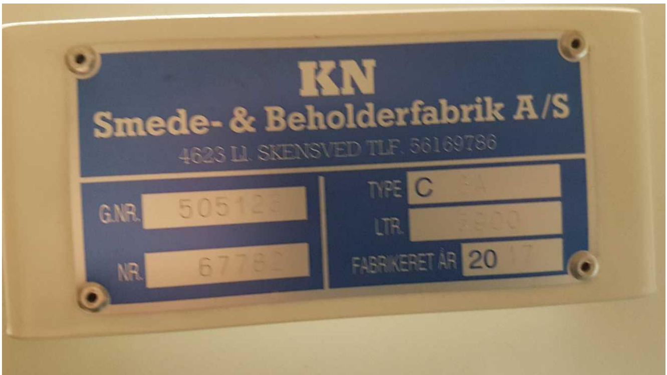
Olietank fra 2017.