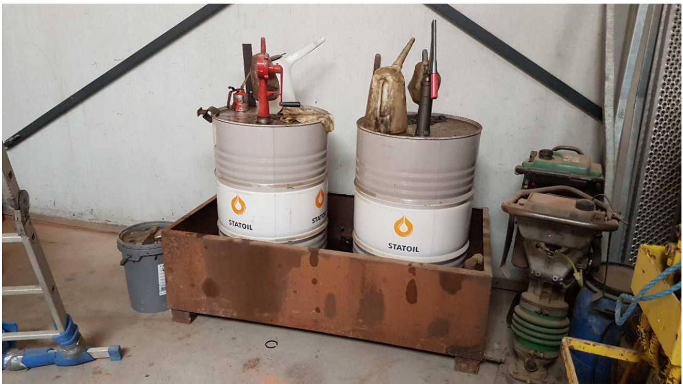
Motorolie og hydraulikolie opbevares på spildbakke.