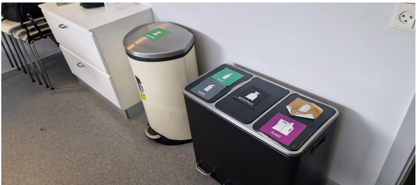
Affaldssortering i frokostrum.