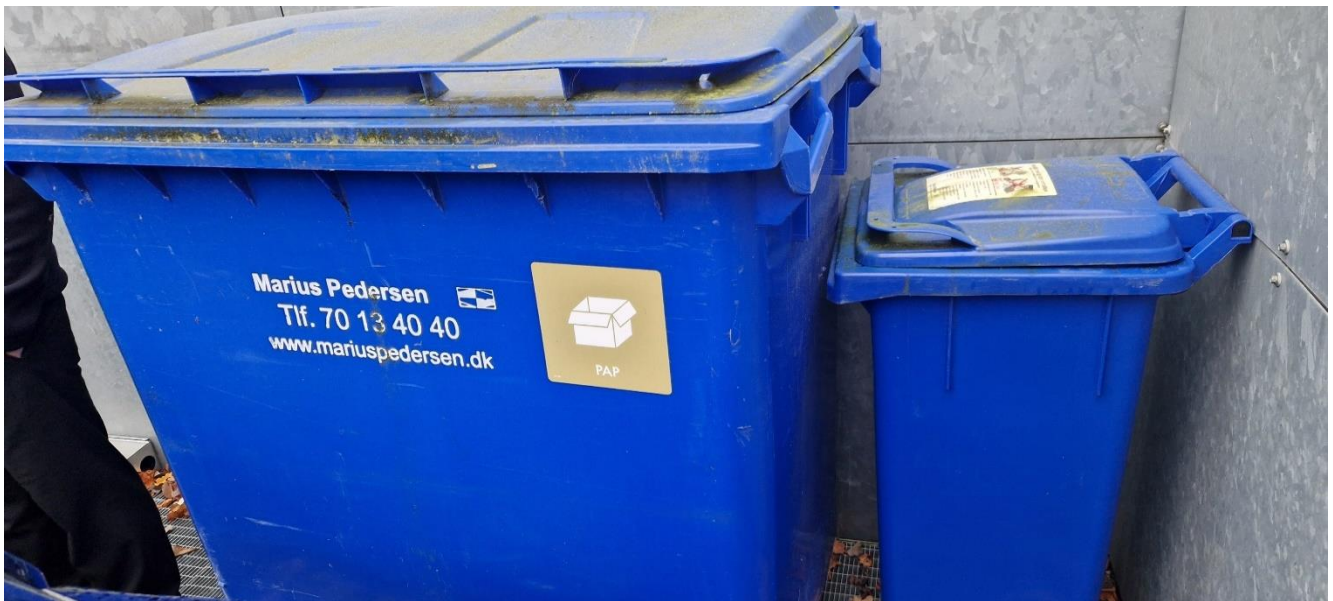
Container til pap og madaffald.