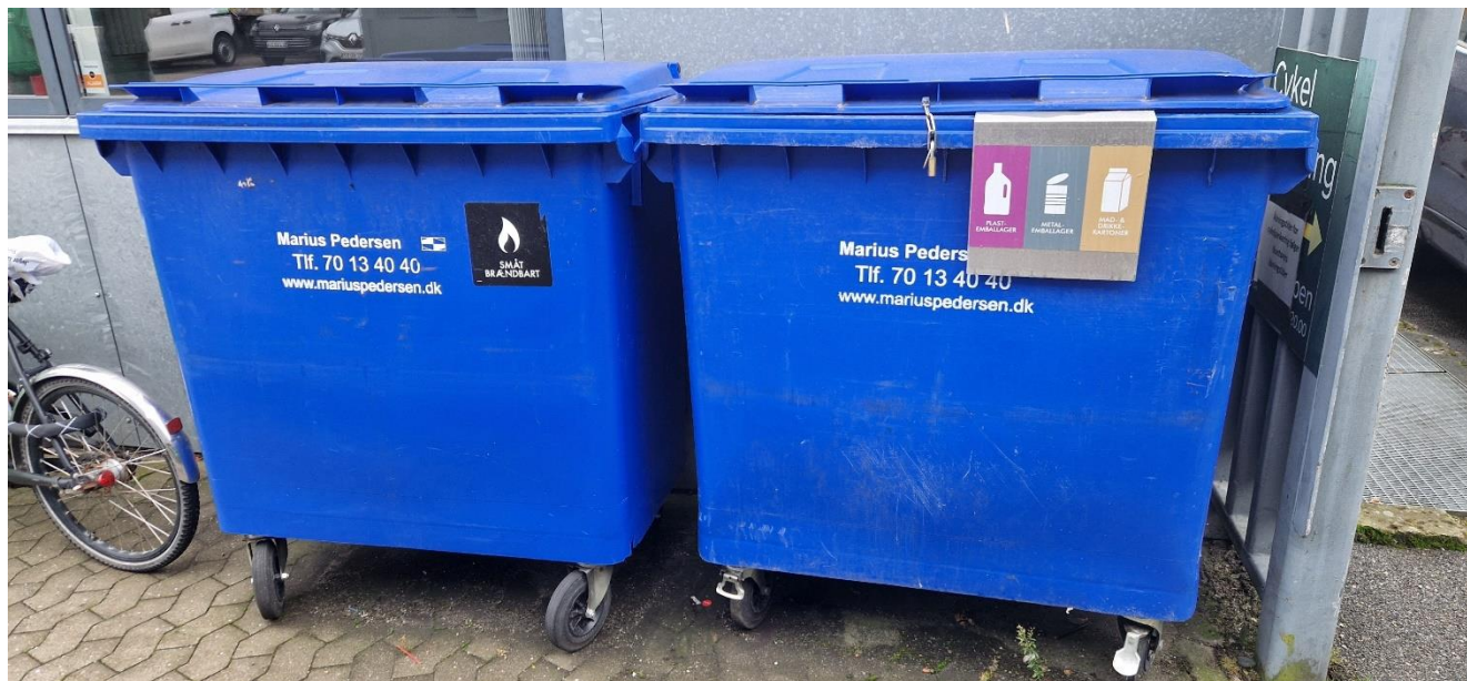
Container til småt brændbart samt plastemballage + metalemballage + mad-/drikkekartoner.