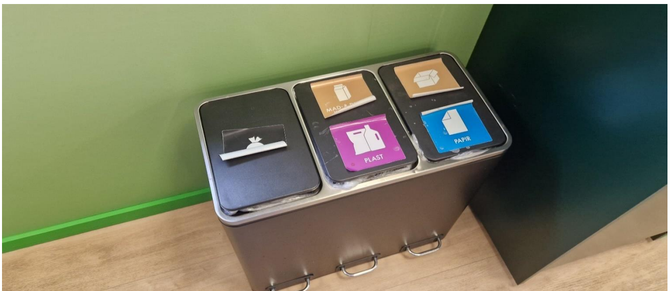
Affaldssortering i kunderum.